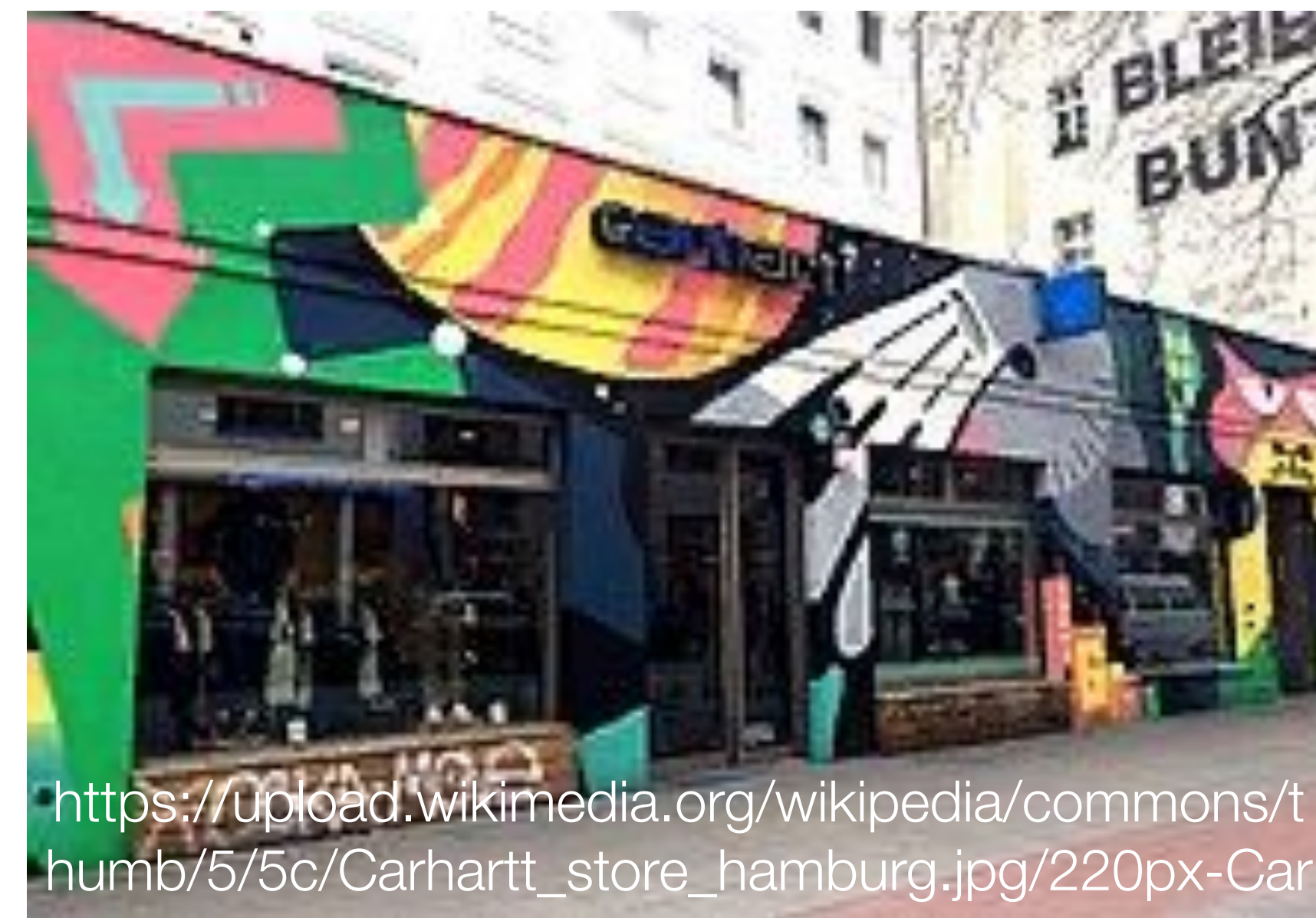
Магазин в Гамбурге