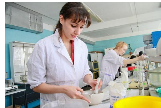
Эксперт по качеству продукции