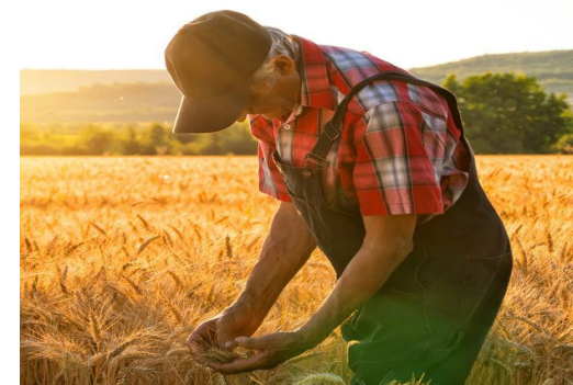
Технолог производства продукции растениеводства