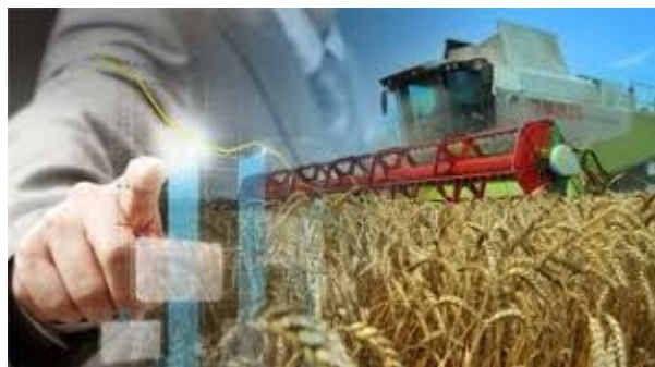
Руководитель в АПК