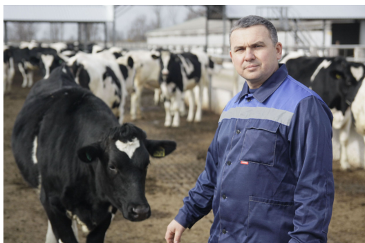
Технолог животноводческого производства