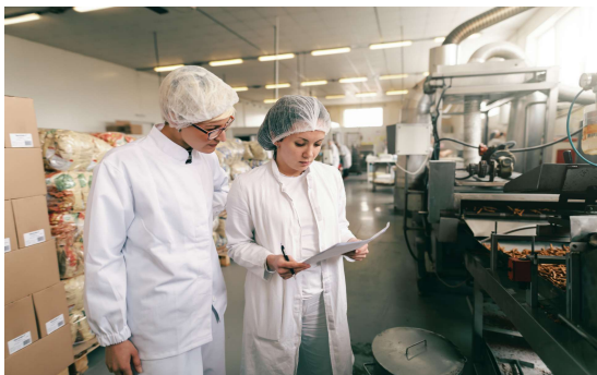
Технолог перерабатывающего предприятия