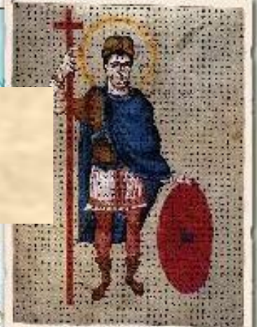
Людвиг Благочестивый, великий миниатюра. 840 г.