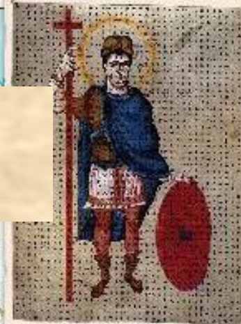
Людвиг Благочестивый, великий миниатюра. 840 г.