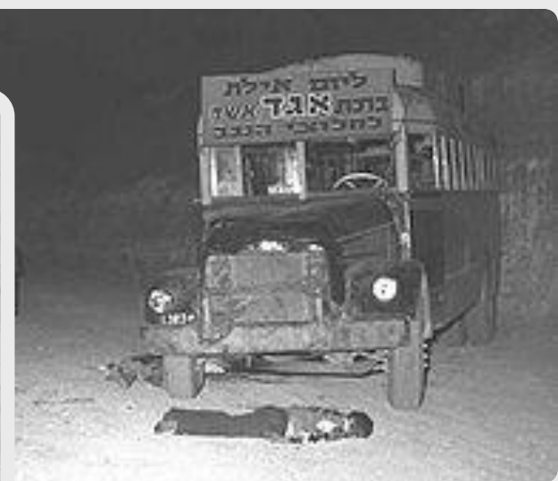
Бойня в Маале-Акробим