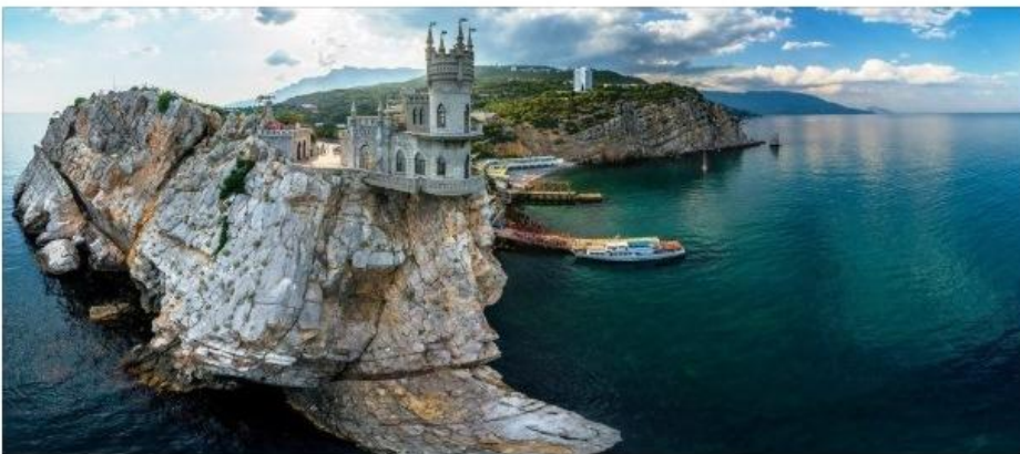
Ласточкино гнездо | KrimRapsodiya

Ты был в Крыму , восхищаешься его красотой , желаешь побывать там и хочешь поделиться этой информацией ? Тогда настало самое время ! #ЭтносоветСКФУ запускает акцию 🚩 «Крым: по-братски» , приуроченную ко Дню воссоединения Крыма с Россией. 🇷🇺 📷 Необходимо выложить в социальные сети фотографии из своего путешествия в Крым , или же фотографии тех мест в Крыму , где хотелось бы побывать , 📍 сопроводить фотографию описанием достопримечательности. ✈️ Этносовет в прошлом году присоединился в двум всероссийским акциям, собрал и отправил книги о культуре, истории и природе Северного Кавказа. Ныне он, по инициативе наших друзей из Крыма информирует студентов, население СКФО и подписчиков из других округов России о достопримечательностях Крыма. Выставляйте , восхищайтесь красотами Великой России ! Но есть обязательное условие : не забудьте про наши хештеги 😊 #Крым_по_братски; #ЭтносоветСКФУ; #Этносовет_Крыму; #СтудентСКФУ; #ФАДНРРоссии; #традиции_братства