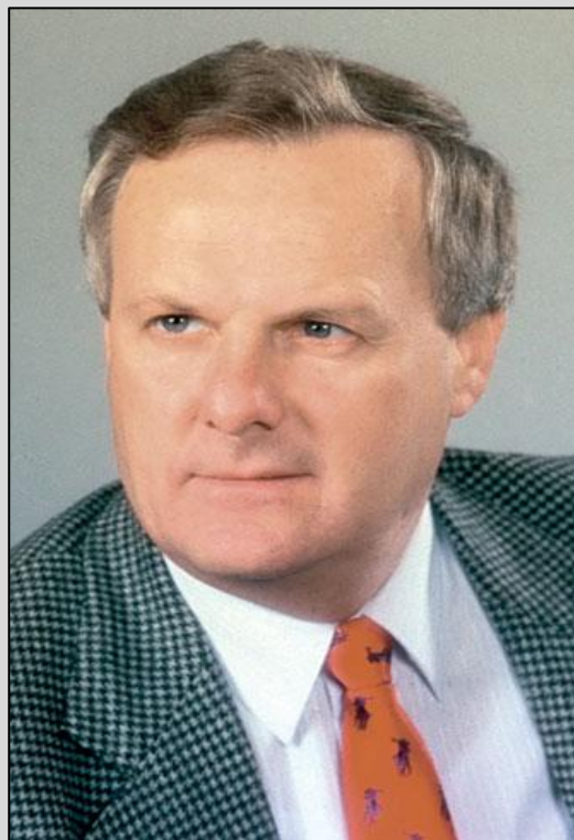
Собчак Анатолий Александрович