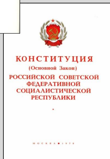
Конституция РСФСР 1978 года