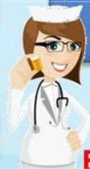
Врачи ГБУ ЛГБ