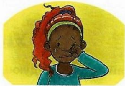
哭 ③ kū