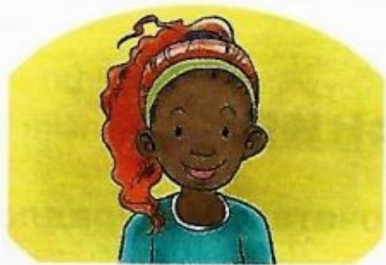
笑 ② xiào