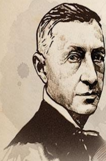
Бунин Иван Алексеевич 1870 - 1953