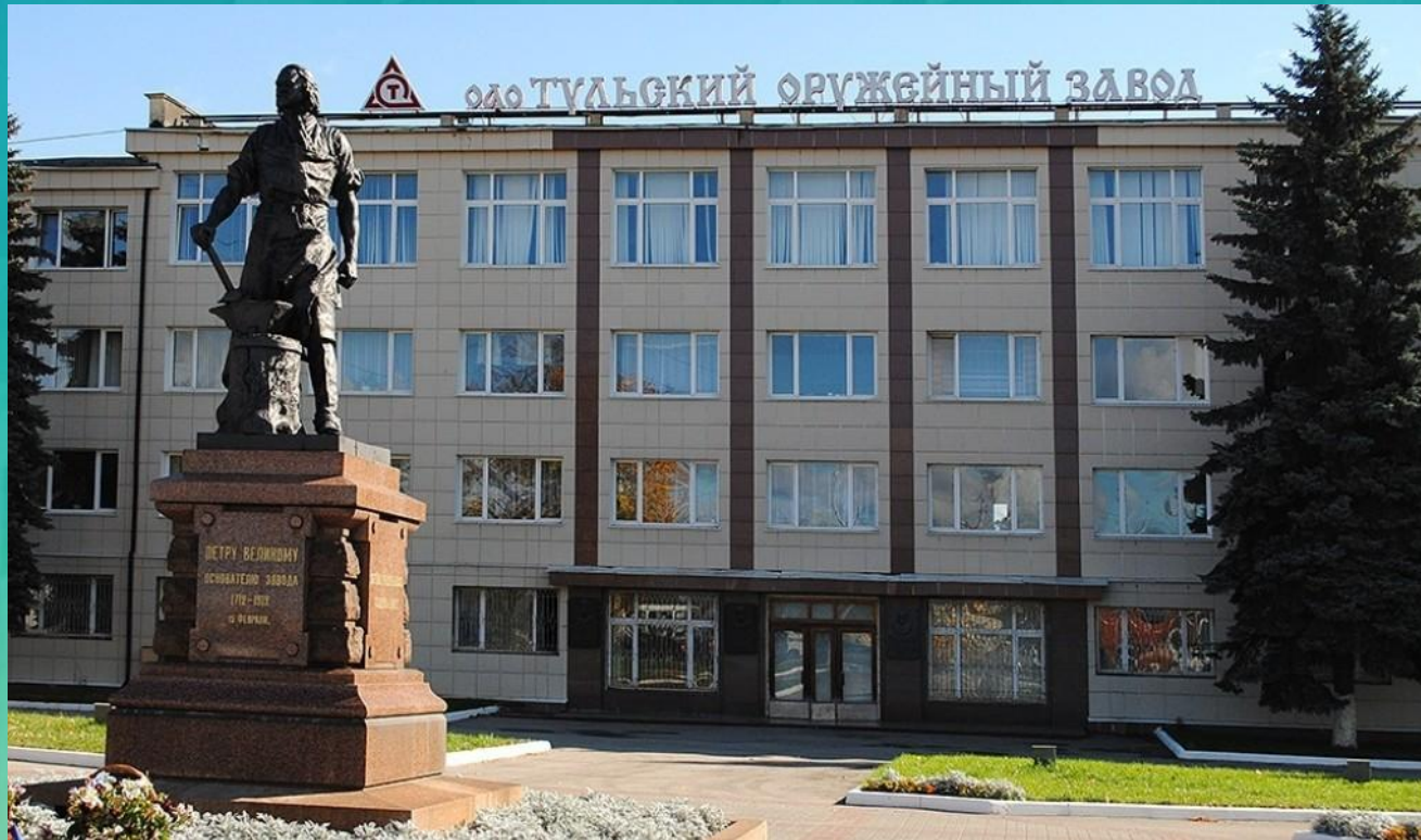
Тульский оружейный завод

Оборонная промышленность, переживающая тяжёлый кризис, выпускает стрелковое оружие (Тула, Ковров), авиационную и ракетную технику (Москва, Королёв, Химки, Реутов, Калуга, Тула, Смоленск), бронетехнику (Калуга), радиоэлектронику (Москва, Зеленоград, Смоленск).