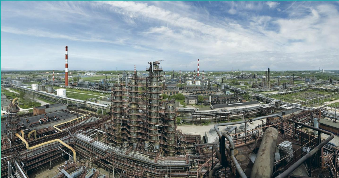
«Рязанская нефтеперерабатывающая компания»

Химическая промышленность- вторая по значению отрасль специализации района. Среди отраслей химической промышленности наиболее важными являются нефтепереработка (Москва, Ярославль, Рязань), производство минеральных удобрений (Воскресенск, Щёкино, Новомосковск), производство полимеров (Ярославль, Тверь, Клин, Орехово-Зуево), производство шин (Москва, Ярославль), бытовая химия (Новомосковск, Одинцово, Ярославль), тонкая химия (Москва).