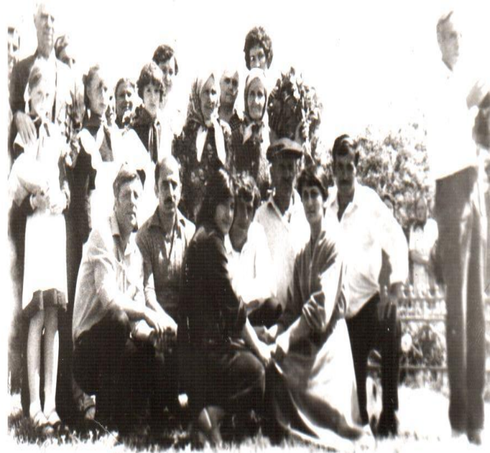
70-е годы встречи с родственниками погибших защитников п. Новотерский у памятника.