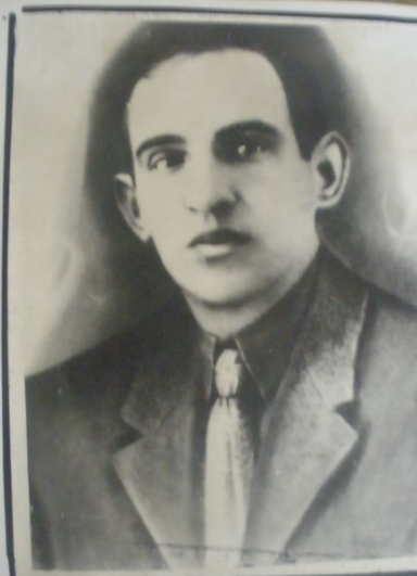
Пиргер А. Э. люб 31 августа 1942 г.