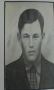
Тарасов люб 31 августа 1942 г.