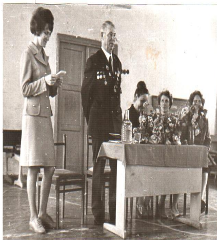
35 лет Великой Победе