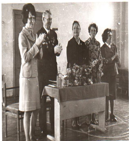
1980 год Встречи с ветеранами