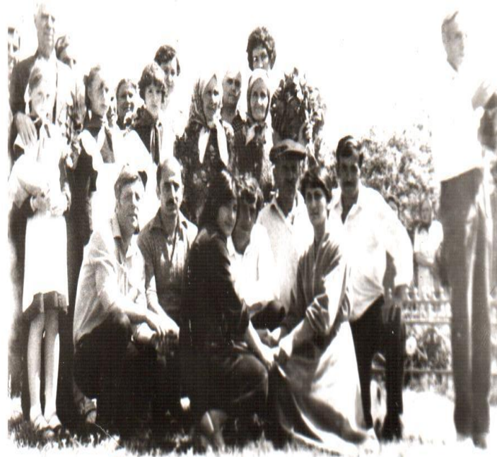
70-е годы встречи с родственниками погибших защитников п. Новотерский у памятника.