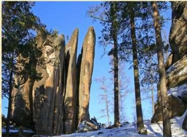
Заповедник «Столбы» Красноярский край