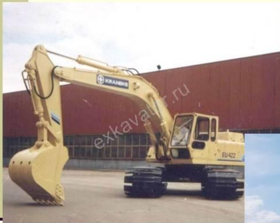
exkavator.ru - EU 422 Эдҫіҫеҫ

Производство экскаваторов, комбайнов Красноярск.