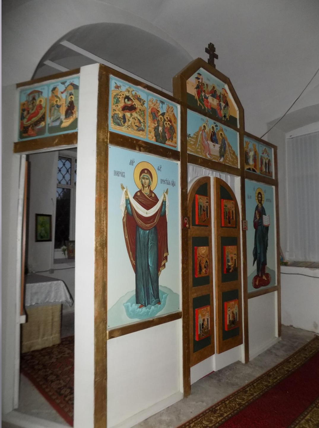
В Храме Преображения Господня. с.Спасское Владимирской обл.