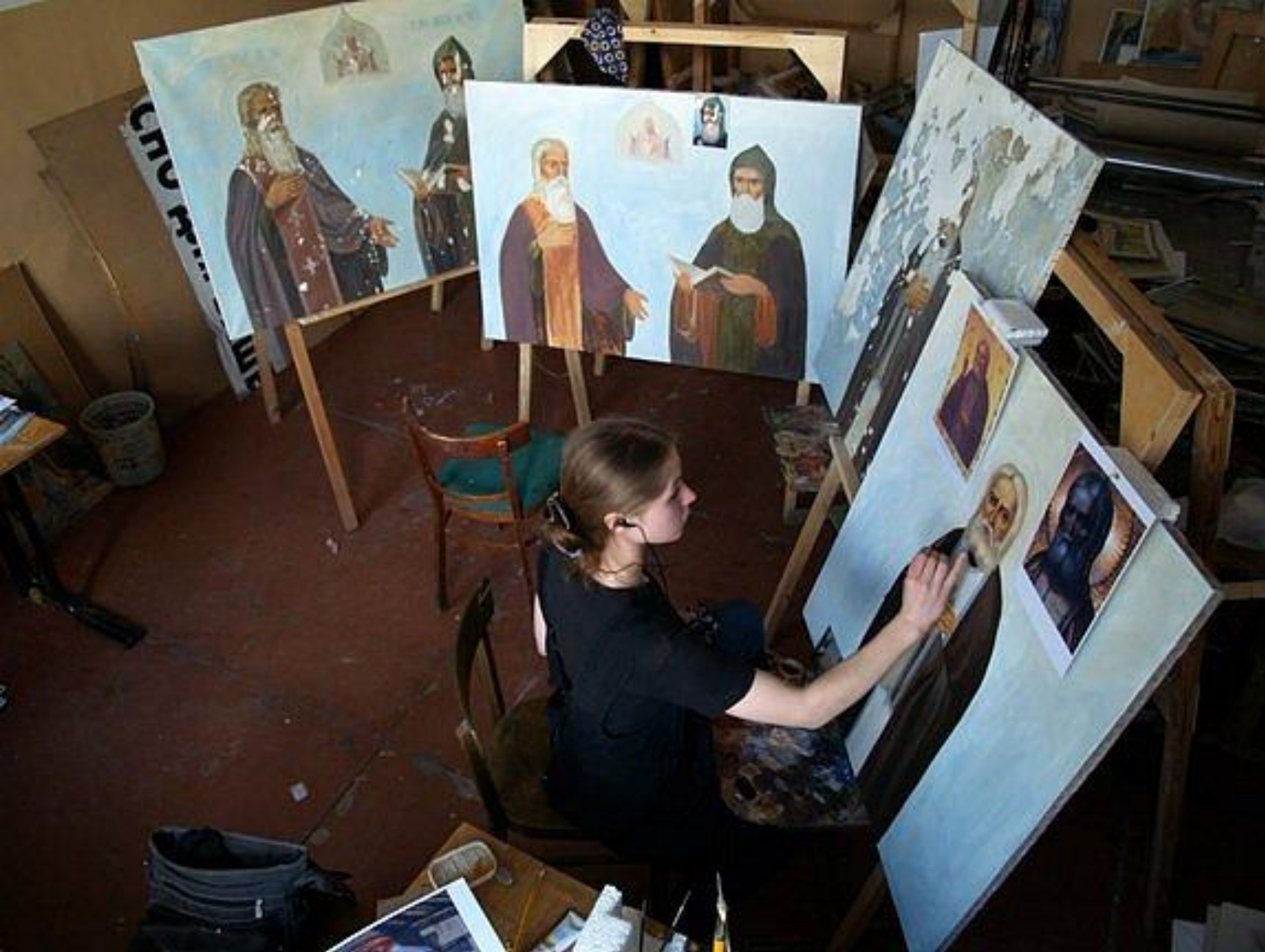
Работа над реставрационным эскизом