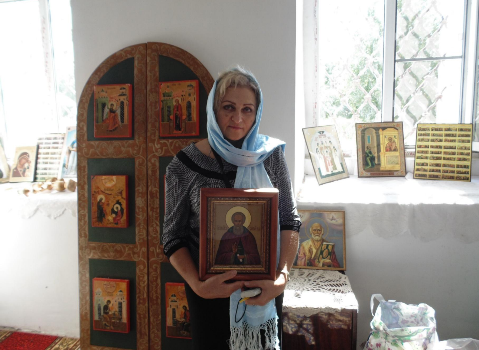
В Храме Преображения Господня. (с.Спасское Владимирской обл.)