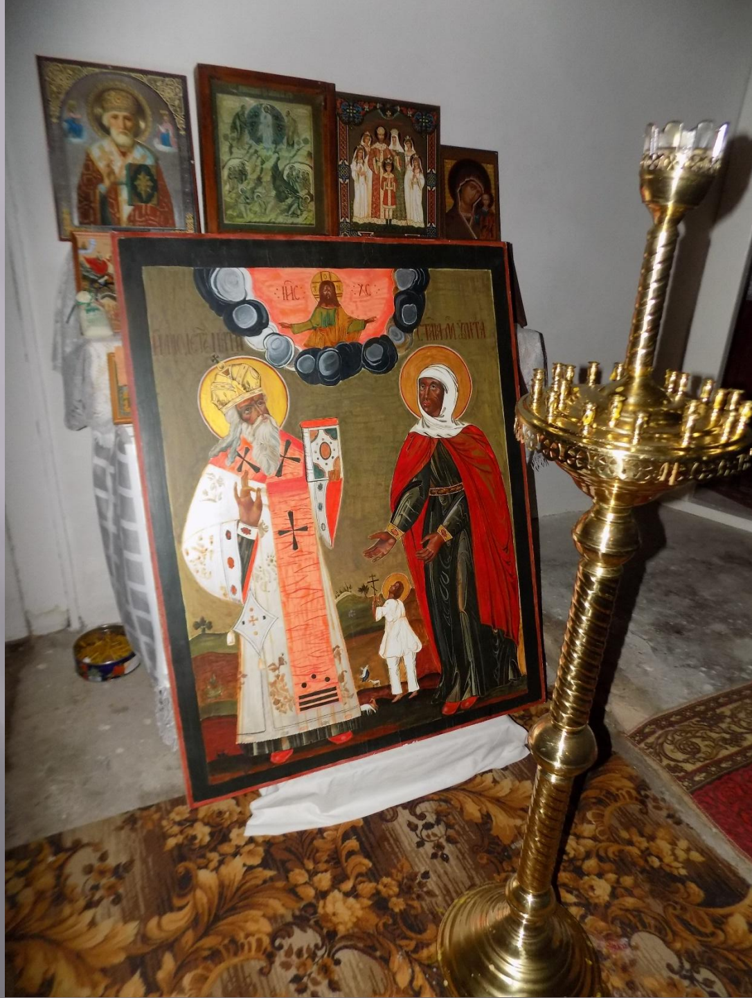
В Храме Преображения Господня. с.Спасское Владимирской обл.