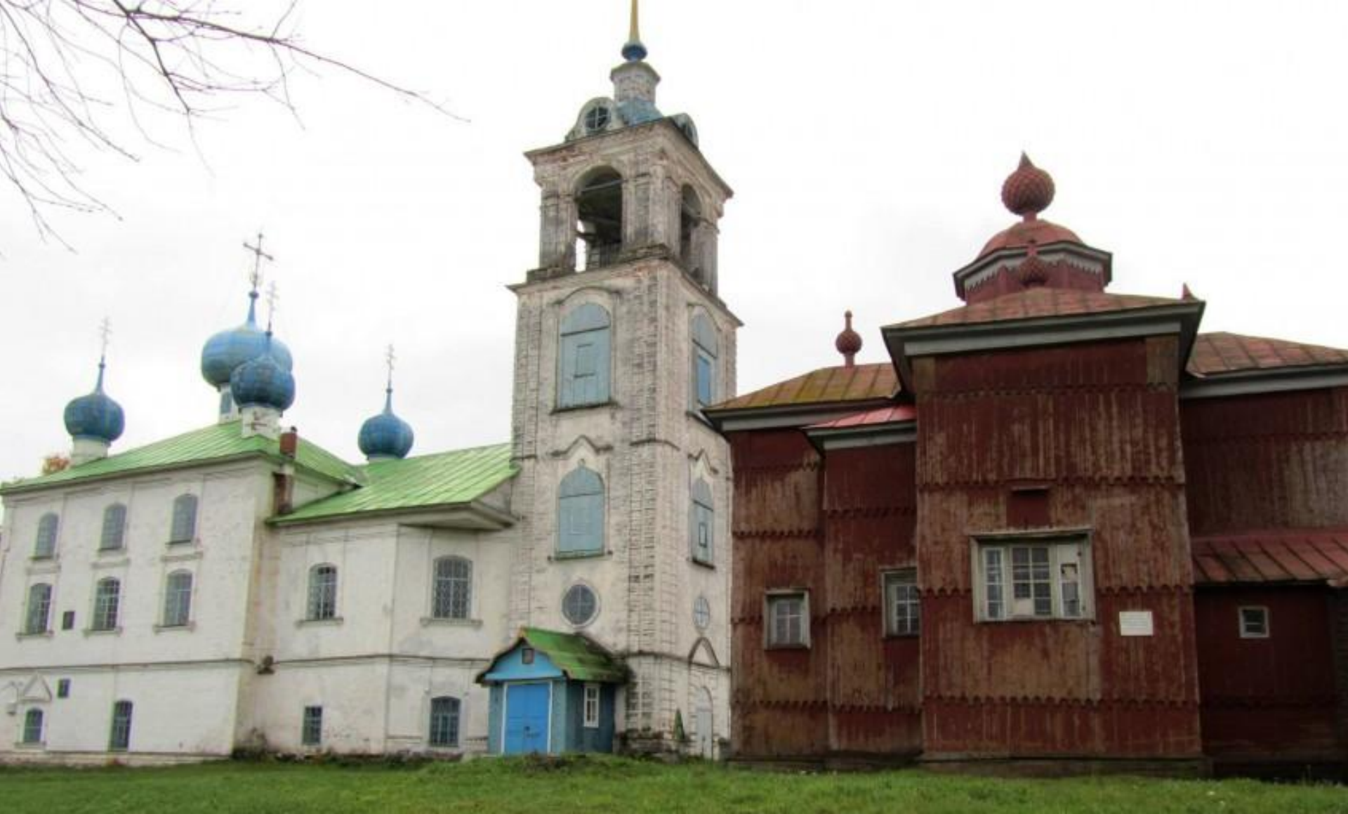
Церковь Николая Чудотворца (1673 г.). (с.Дмитриево Вологодской обл.)