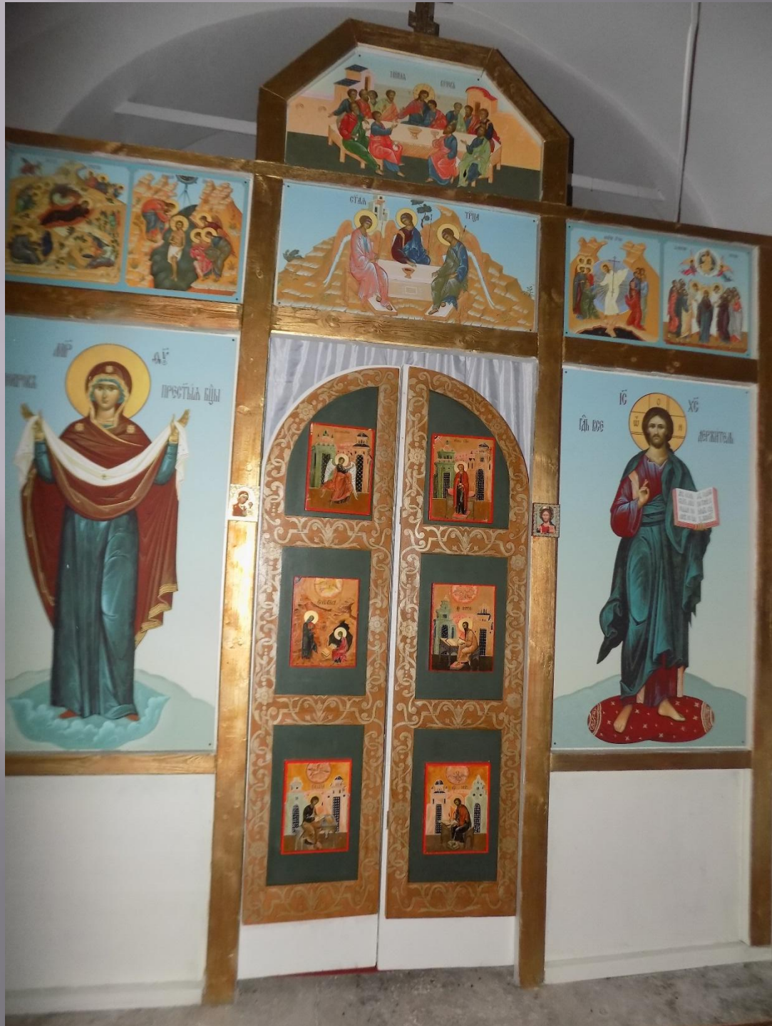
В Храме Преображения Господня. с.Спасское Владимирской обл.