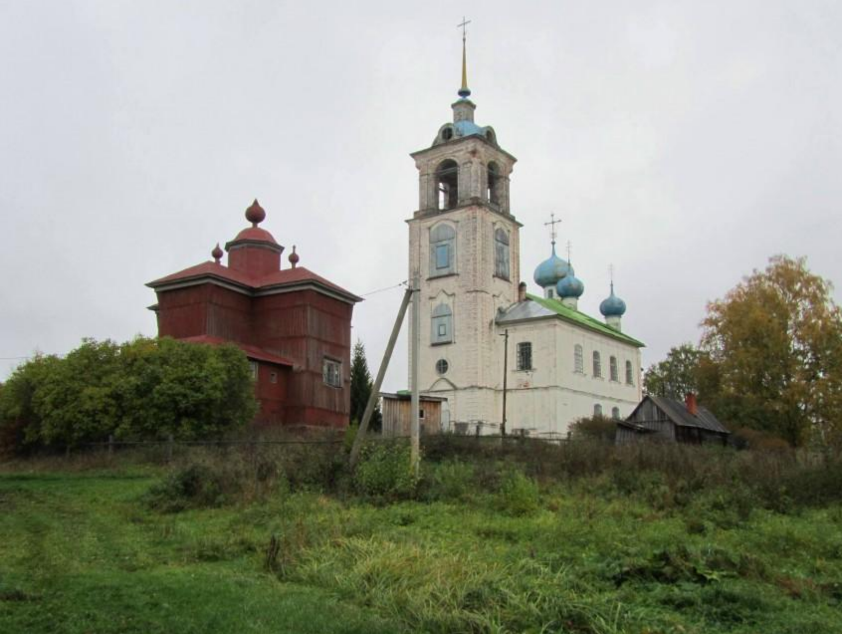
Церковь Николая Чудотворца (1673 г.). (с.Дмитриево Вологодской обл.)