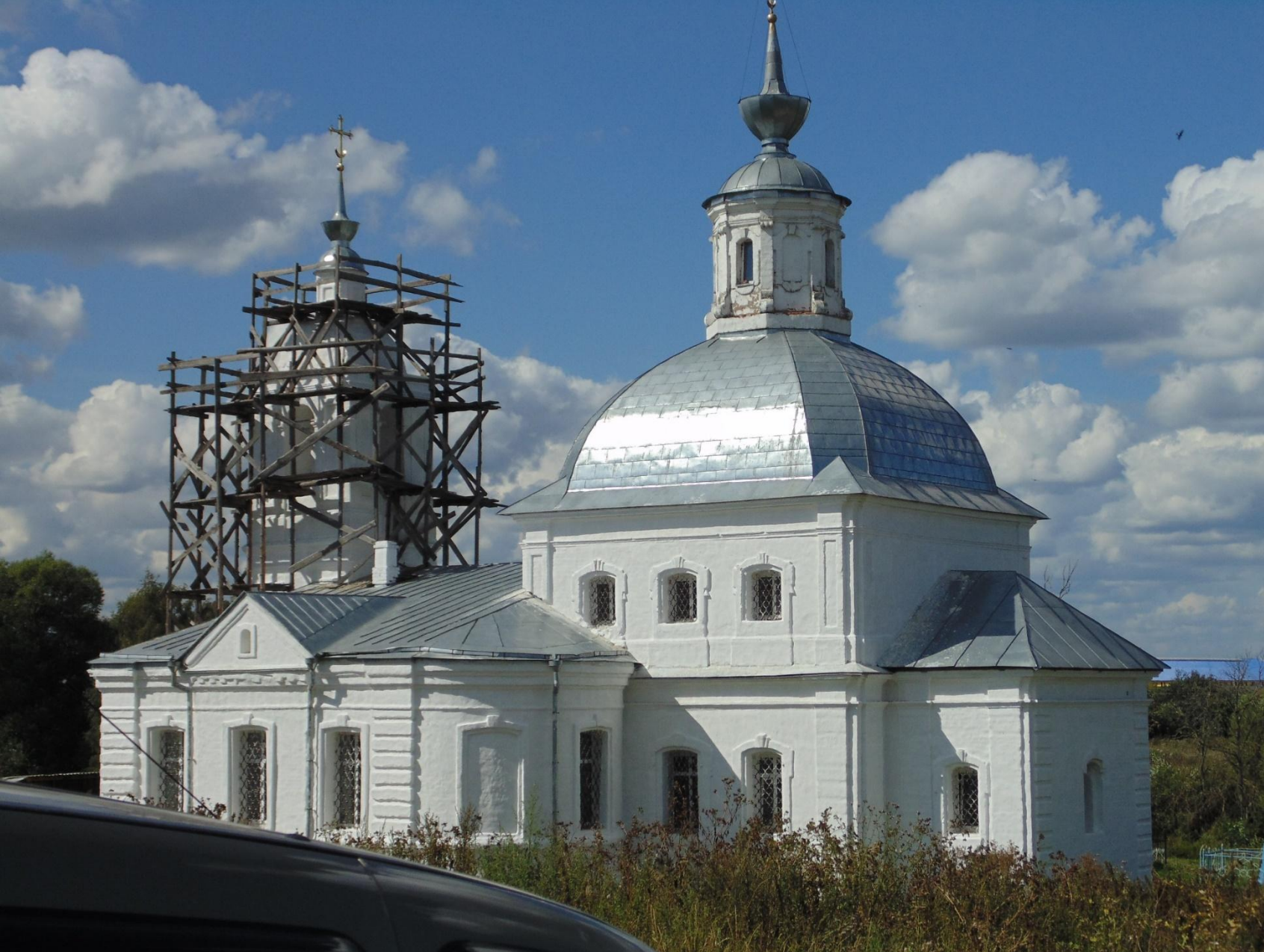
Храм Преображения Господня (1761 г.). (с.Спасское Владимирской обл.)