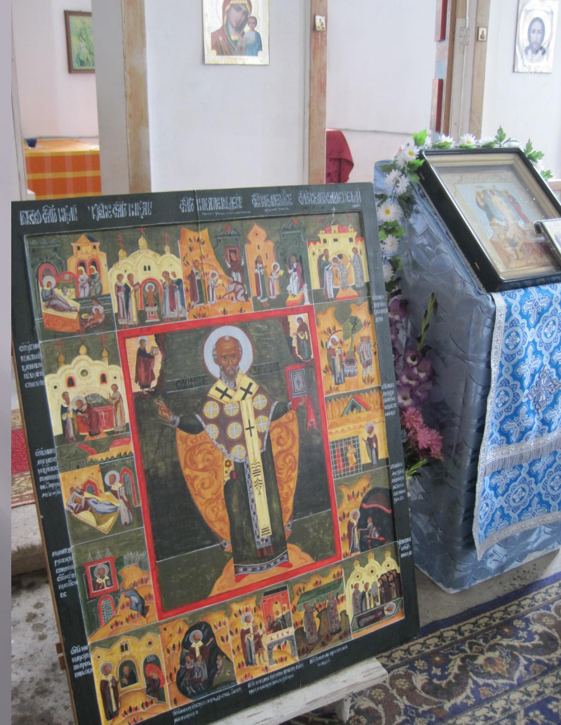
В Храме Преображения Господня. с.Спасское Владимирской обл.)