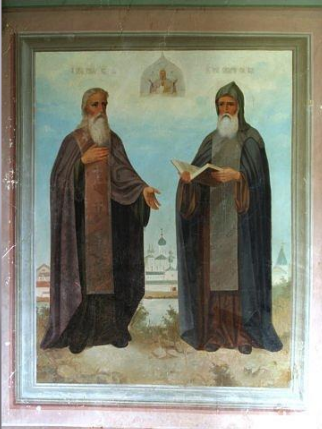
свв. Зосима и Савватий после реставрации. (часть ВКР, автор: Кашоид Михаил)