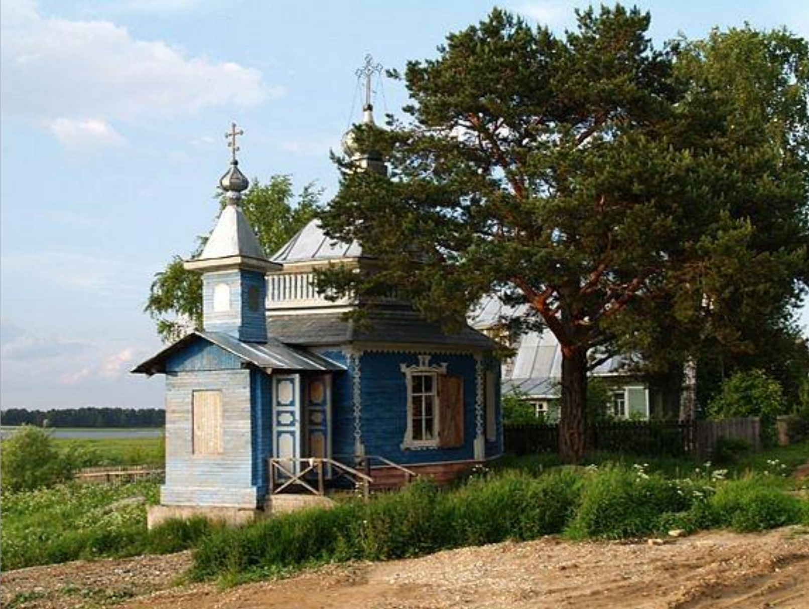
Ильинская часовня в деревне Чернышево Усть-Кубинского р-на. Построена в 1903 году