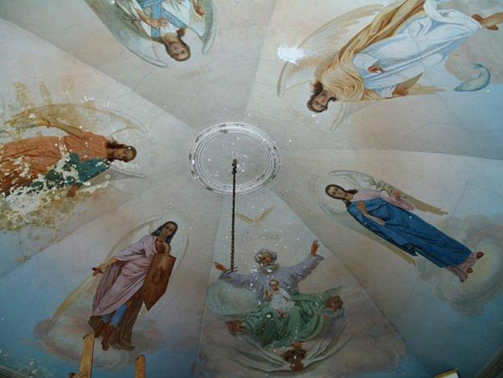
Масляная живопись начала XX века. Росписи Ильинской часовни. Купол