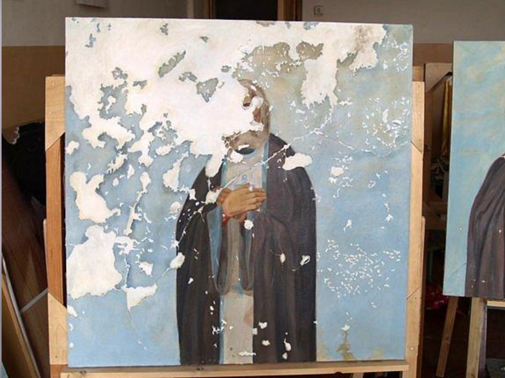
св. Серафим Саровский, копия со всеми утратами, масштаб 1:1