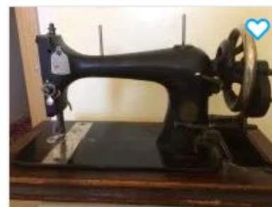
Швейная машинка Singer (Зингер)