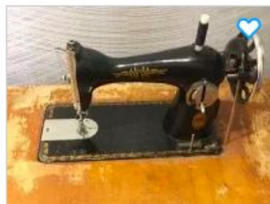
Швейная машина Подольск