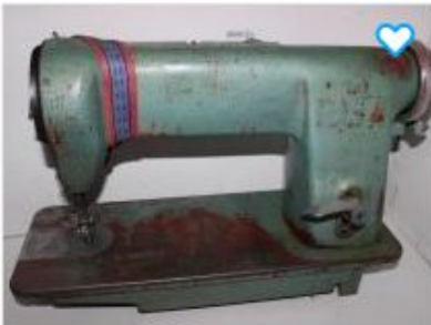
Машина швейная 97 класса