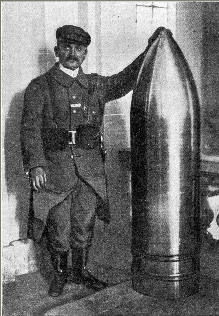
Новая тяжелая французская артиллерия. Снарядъ въ 400 миллиметровъ въ діаметръ, выставленный въ Парижъ для обозрѣнія публики.