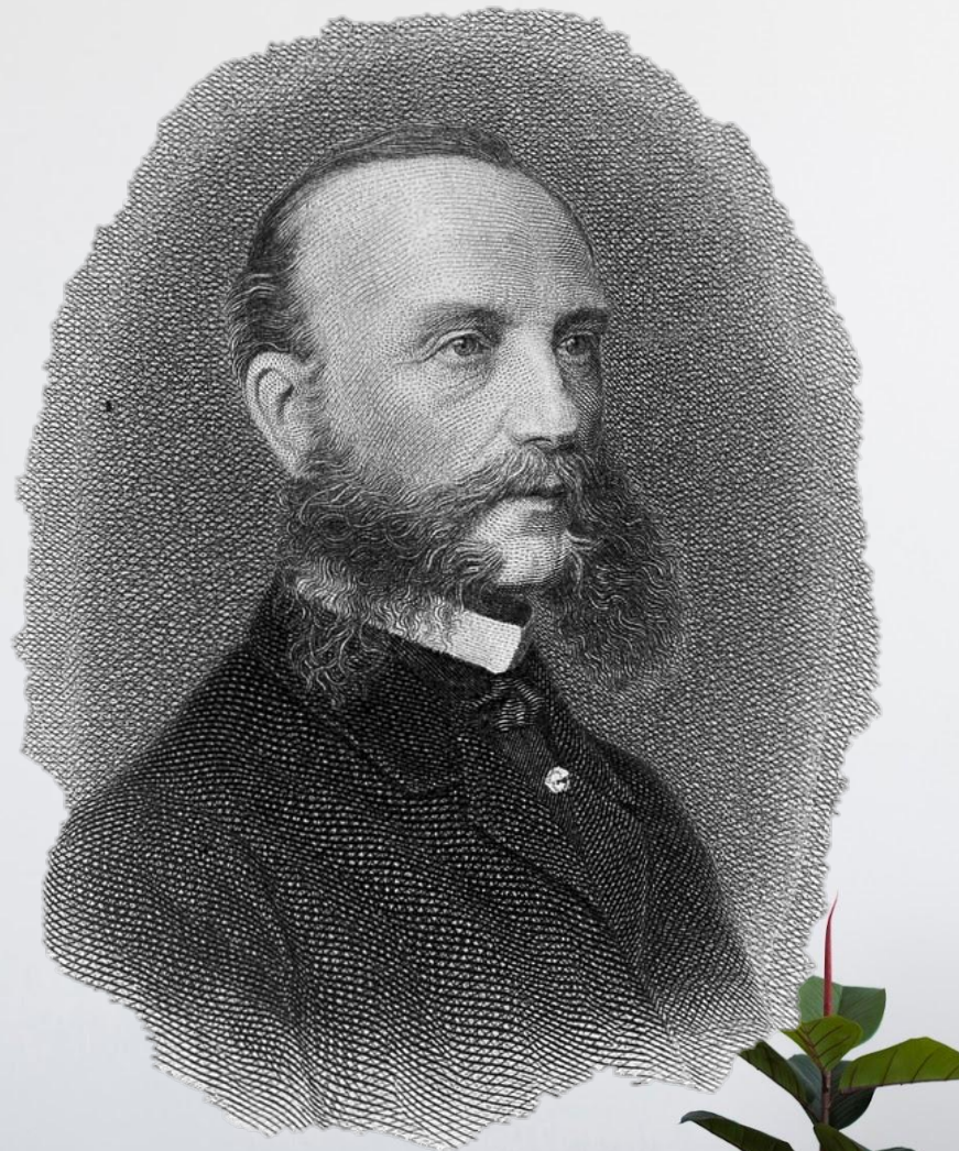
Вильгельм Гризингер (1817 – 1868)

На более высокую научную ступень поднялось учение немецкого психиатра В. Гризингера. Он объяснял психические заболевания с материалистических позиций, утверждая возможность рефлекторной природы психической деятельности и считая психические нарушения результатом болезни мозга. Гризингер был не только сторонником взглядов Конолли, но и претворял его идеи в жизнь. Он настаивал на освобождении больных от всяческих мер стеснения и оказания им медицинской помощи.