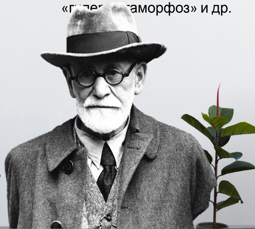
Зигмунд Фрейд ( 1856 -1939)

Широкое распространение на Западе, в США получила концепция психоанализа З. Фрейда, так называемый фрейдизм. Австрийский психоневролог З. Фрейд в конце прошлого столетия выдвинул теорию, согласно которой подсознательная деятельность человека является основой его психической деятельности. По Фрейду, в подсознательную сферу вытесняются неизжитые «комплексы» человека, его неудовлетворенные влечения. Фрейд утверждал, что истинная сущность человека заключается в подсознательной сфере, что она неизвестна, таинственна, так как находится под постоянным влиянием «цензуры» - сознания, «сверх-Я».