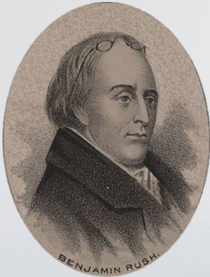
Бенджамин Раш (1745 – 1813)

Большую роль в организации помощи психически больным в США сыграл Б. Раш. Он также стоял за гуманное отношение к психическим больным. Развитие психиатрии в Германии было связано с господствованием здесь в первой половине XIX века идеалистических взглядов на сущность психических процессов. Философы-идеалисты того времени (И. Кант, Г. Гегель, Ф. Шеллинг), признавая первичность духа, способствовали тем самым становлению дуализма в психиатрии, что привело к образованию двух идеологических школ: «психиков» и «соматиков»