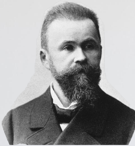
Карл Вернике (1848-1905)

Немецкий ученый Вернике внес существенный вклад в развитие анатомо-физиологического направления в психиатрии. Он изучал клинику и патологическую анатомию энцефалопатии, афазических расстройств, ввел в науку клинические понятия «сверхценные идеи», «гипертрофия» и др.