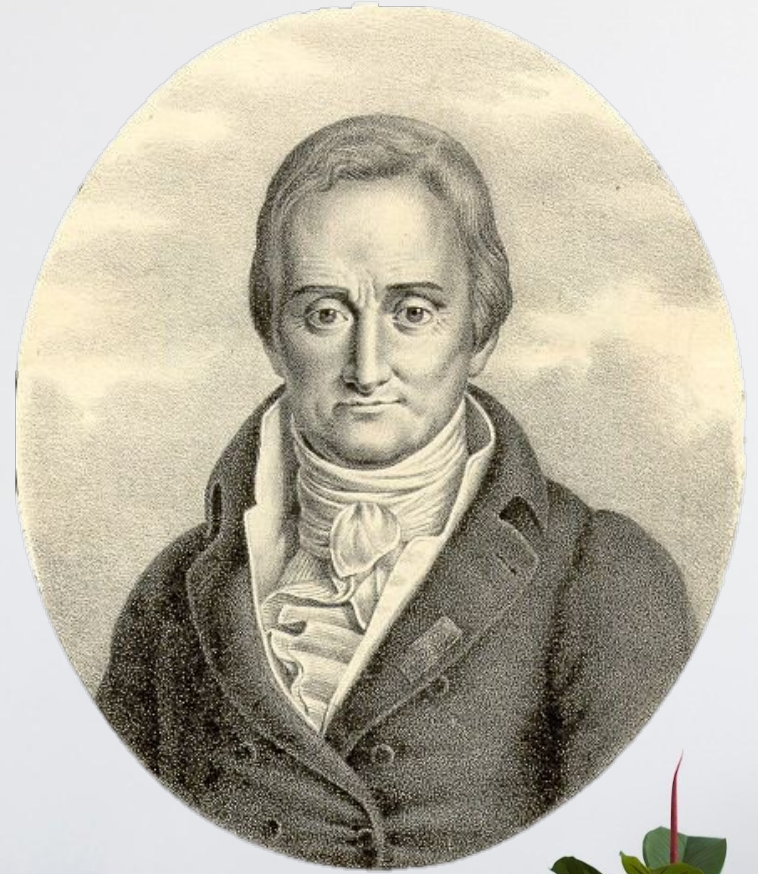
Ф. Пинель (1745 – 1826)

Большая заслуга в решении этого вопроса принадлежит выдающемуся французскому психиатру Ф. Пинелю, главному врачу крупной психиатрической больницы. Он снял с душевнобольных сковывающие железные цепи, что способствовало их успокоению и улучшению общего состояния. Имя Пинеля вошло в историю мировой психиатрии, но реформа его не была при нем завершена. По-прежнему применялись смирительные рубашки, ремни другие средства насильственного удерживания больных.