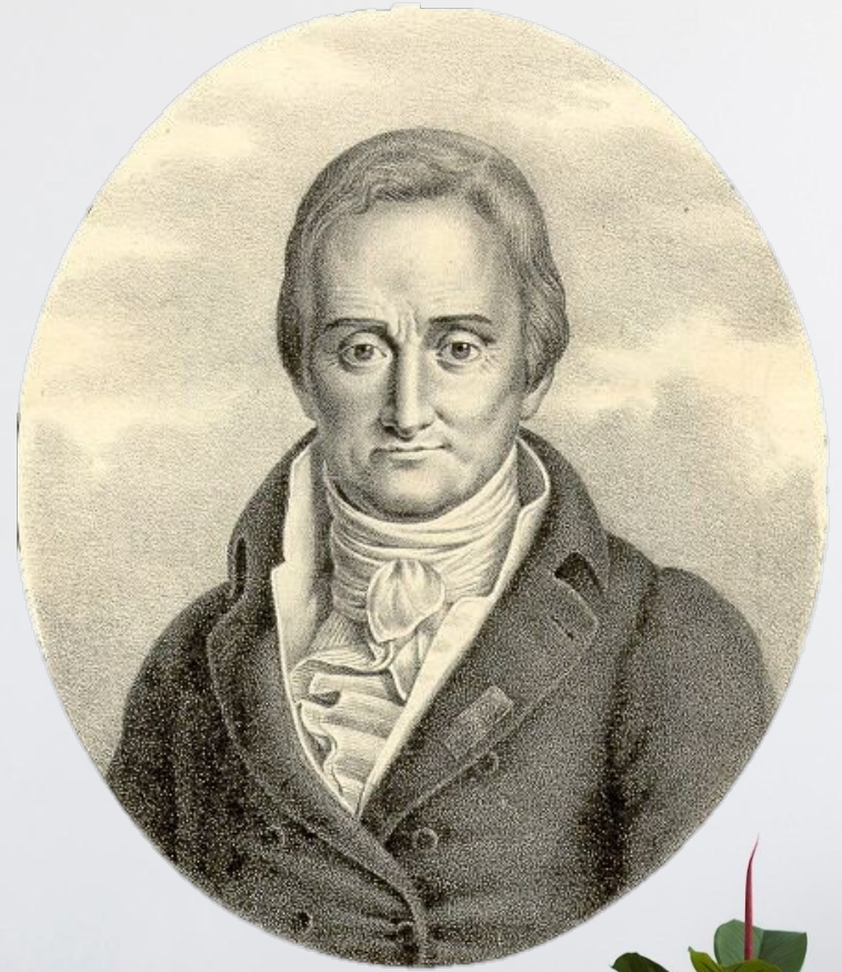
Ф. Пинель (1745 – 1826)

Большая заслуга в решении этого вопроса принадлежит выдающемуся французскому психиатру Ф. Пинелю, главному врачу крупной психиатрической больницы. Он снял с душевнобольных сковывающие железные цепи, что способствовало их успокоению и улучшению общего состояния. Имя Пинеля вошло в историю мировой психиатрии, но реформа его не была при нем завершена. По-прежнему применялись смирительные рубашки, ремни другие средства насильственного удерживания больных.