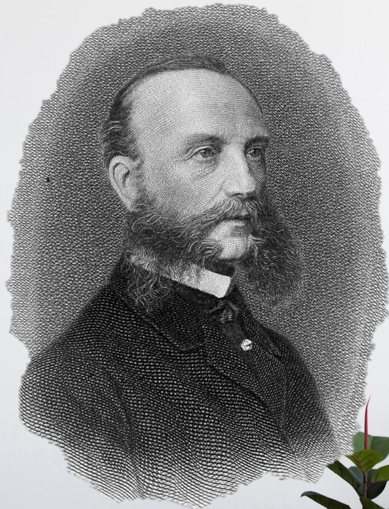
Вильгельм Гризингер (1817 – 1868)

На более высокую научную ступень поднялось учение немецкого психиатра В. Гризингера. Он объяснял психические заболевания с материалистических позиций, утверждая возможность рефлекторной природы психической деятельности и считая психические нарушения результатом болезни мозга. Гризингер был не только сторонником взглядов Конолли, но и претворял его идеи в жизнь. Он настаивал на освобождении больных от всяческих мер стеснения и оказания им медицинской помощи.