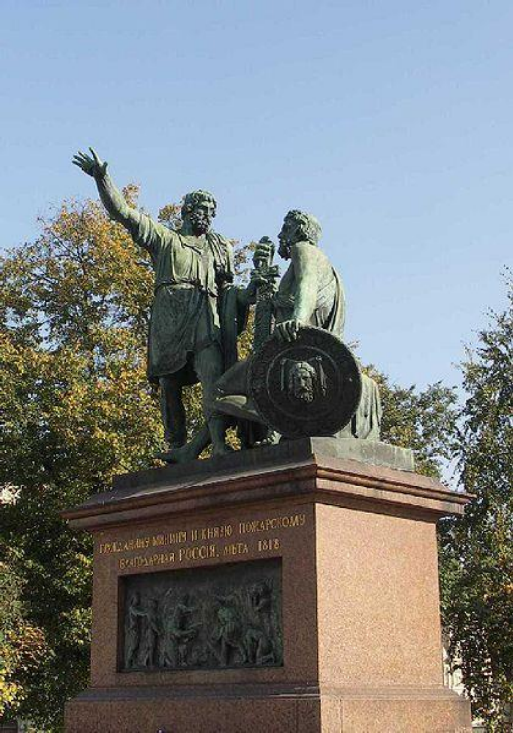
И.П. Мартос. Памятник Минину и Пожарскому.