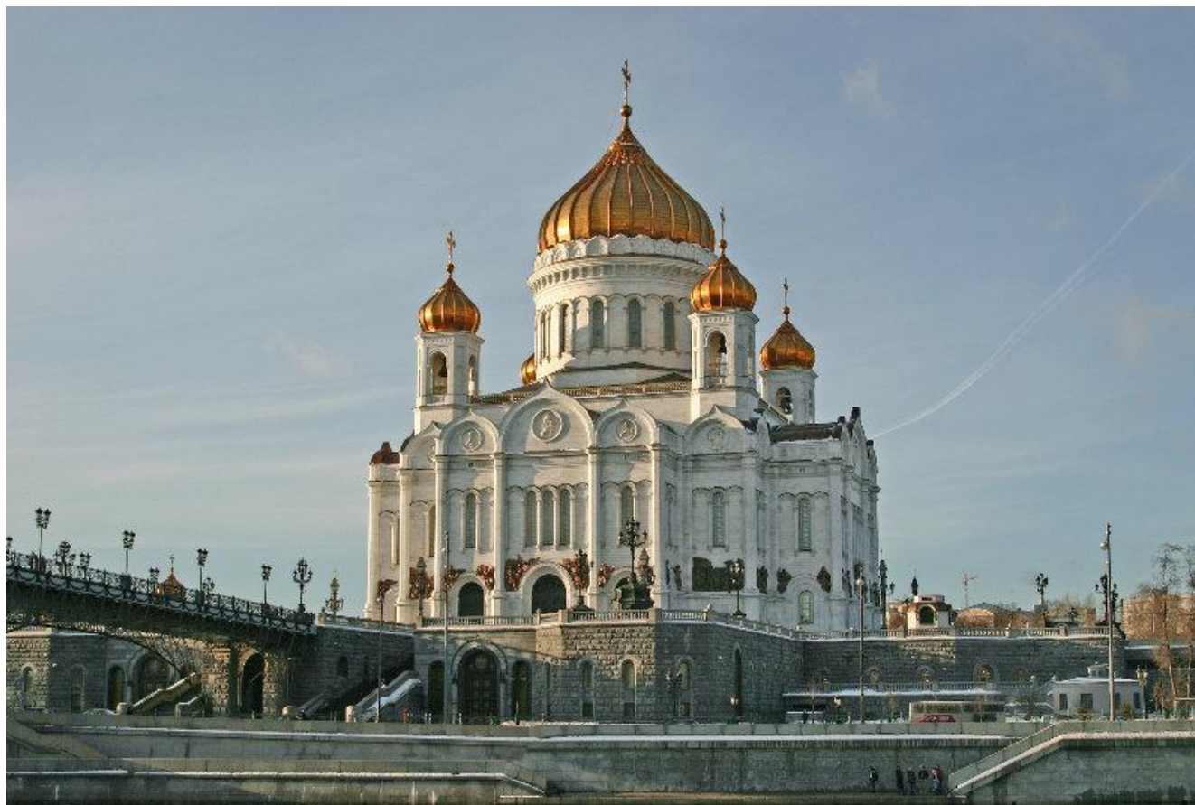
храм Христа Спасителя (К.А. Тон)