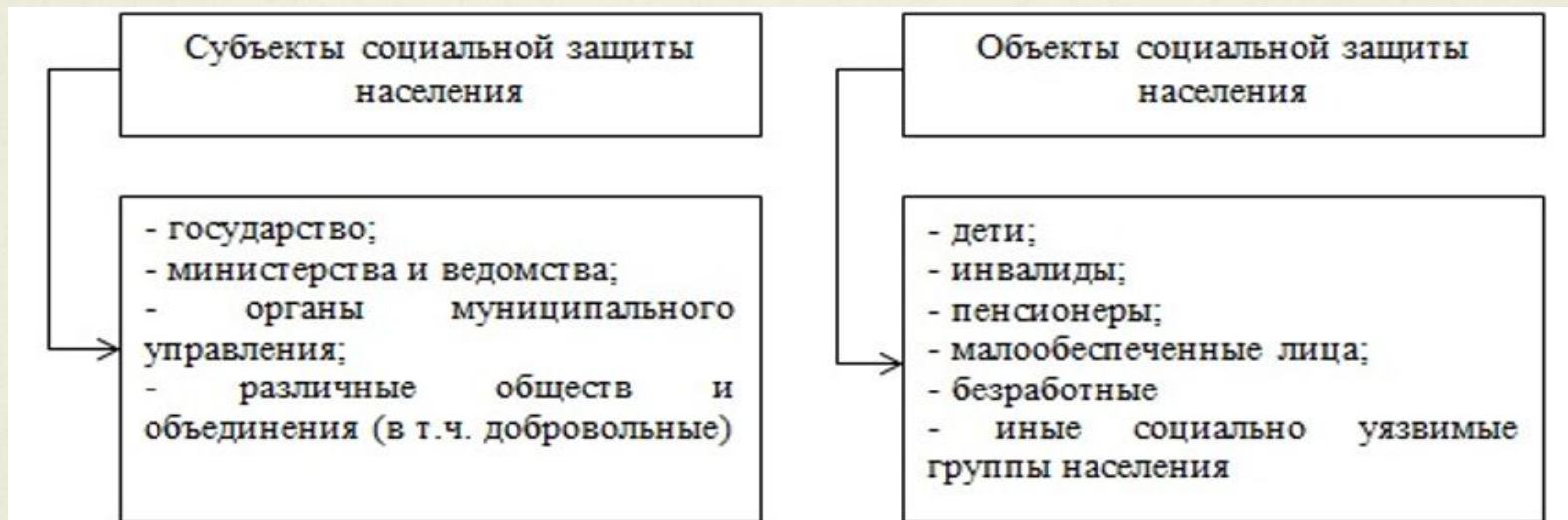
Рисунок 1.1 - Субъекты и объекты социальной защиты населения

На рисунке 1.1 представлена характеристика субъектов и объектов социальной защиты населения.