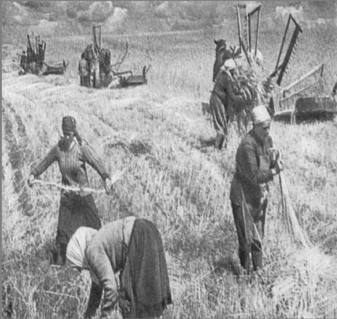
Подметали на полях рассыпанную пшеницу