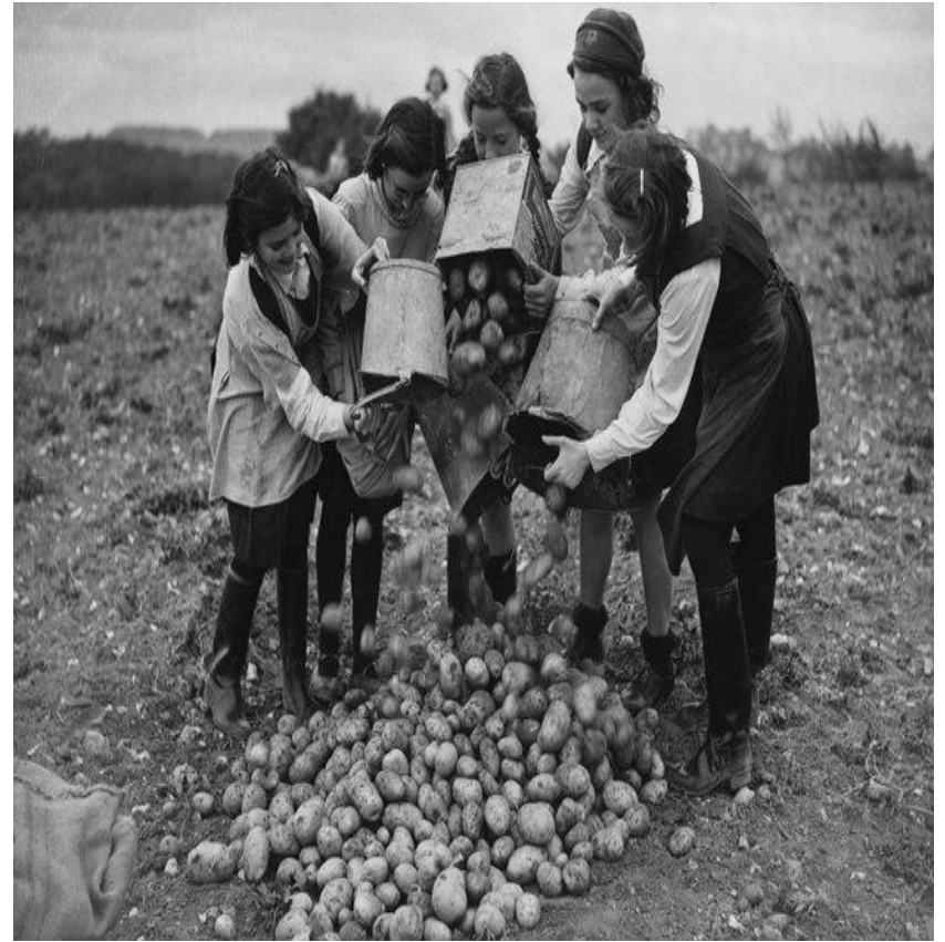
Собирали гнилую и мороженую картошку