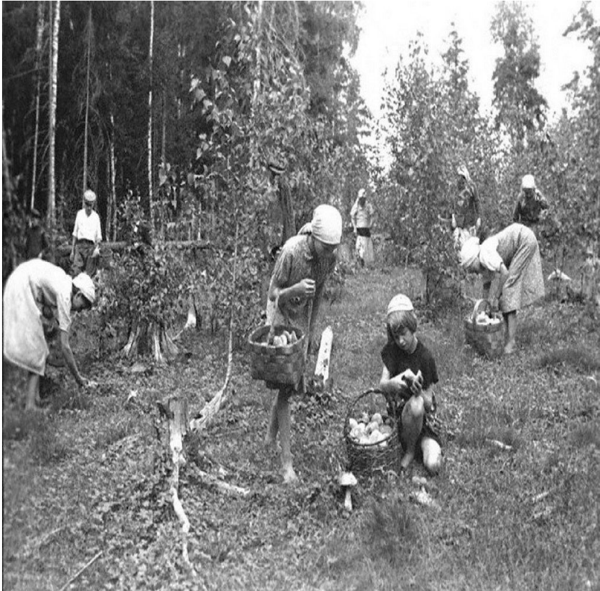
Собирали грибы и ягоды