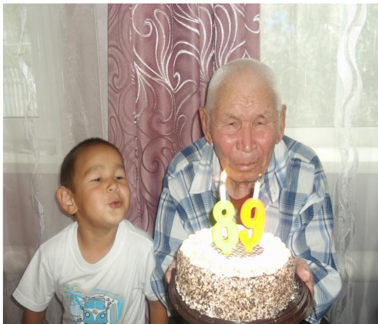
На день рождение прадедушки.