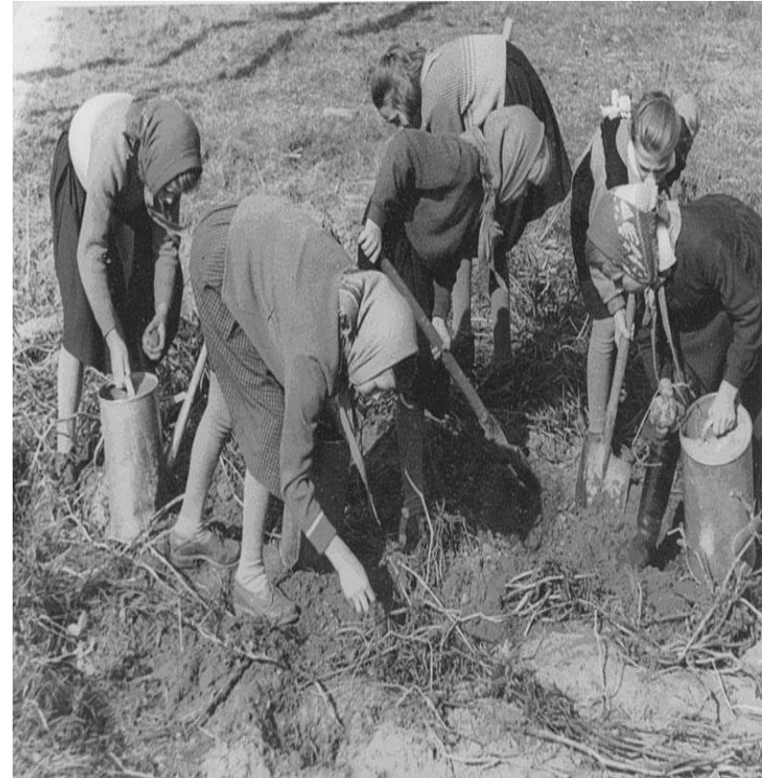
Собирали и ели съедобную траву