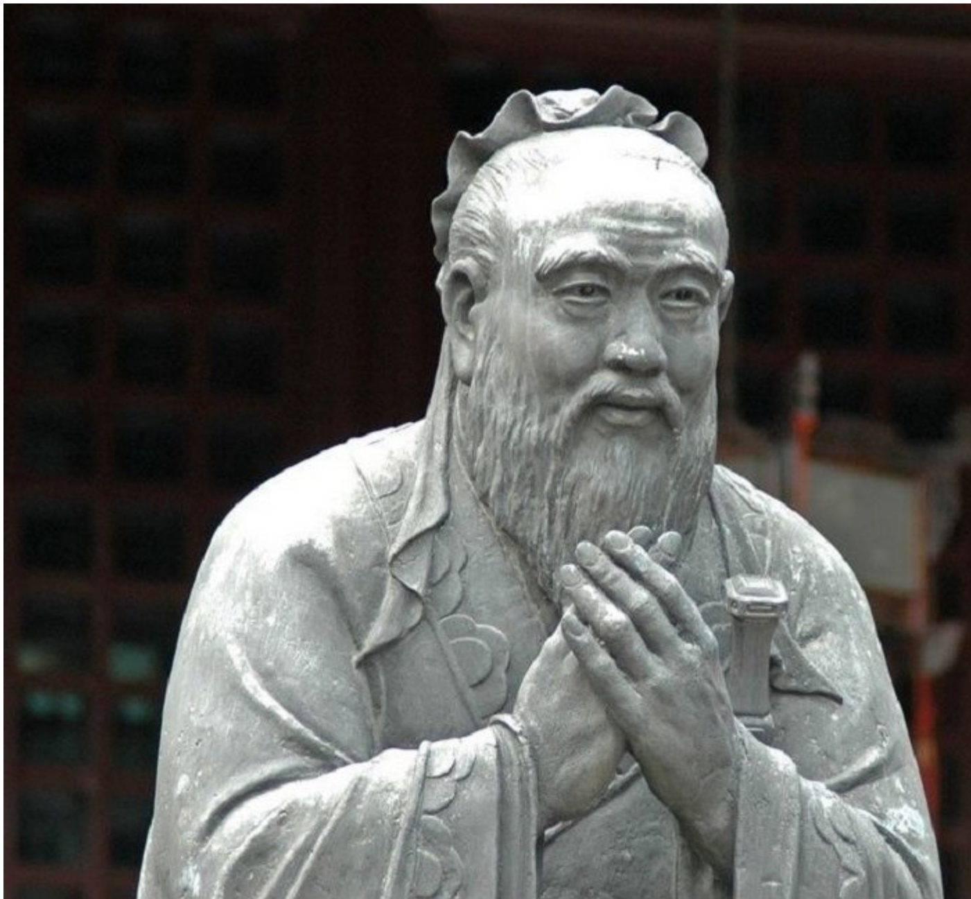
КОНФУЦИЙ китайский философ V-IV вв. до н.э.