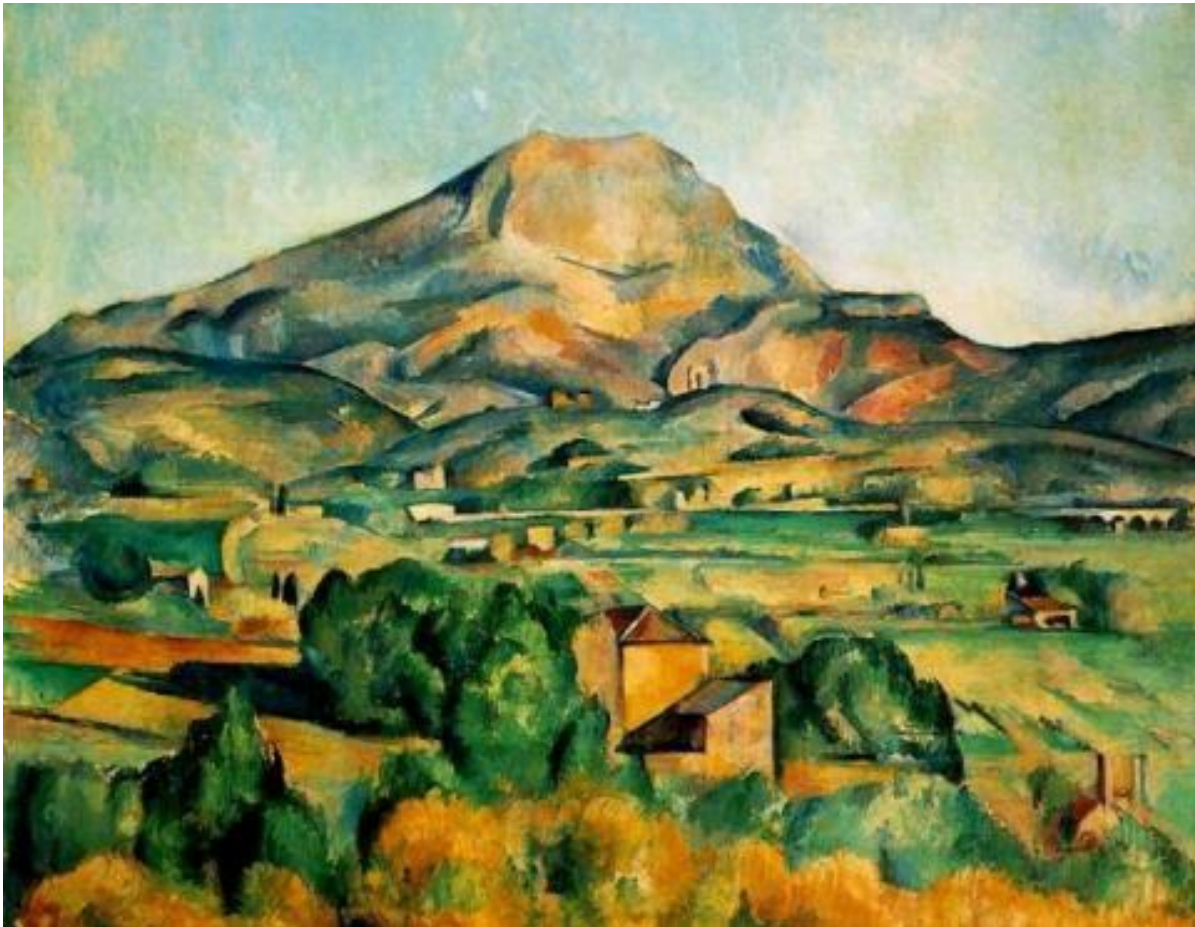
Поль Сезанн. Гора Сент-Виктуар. XIXв.