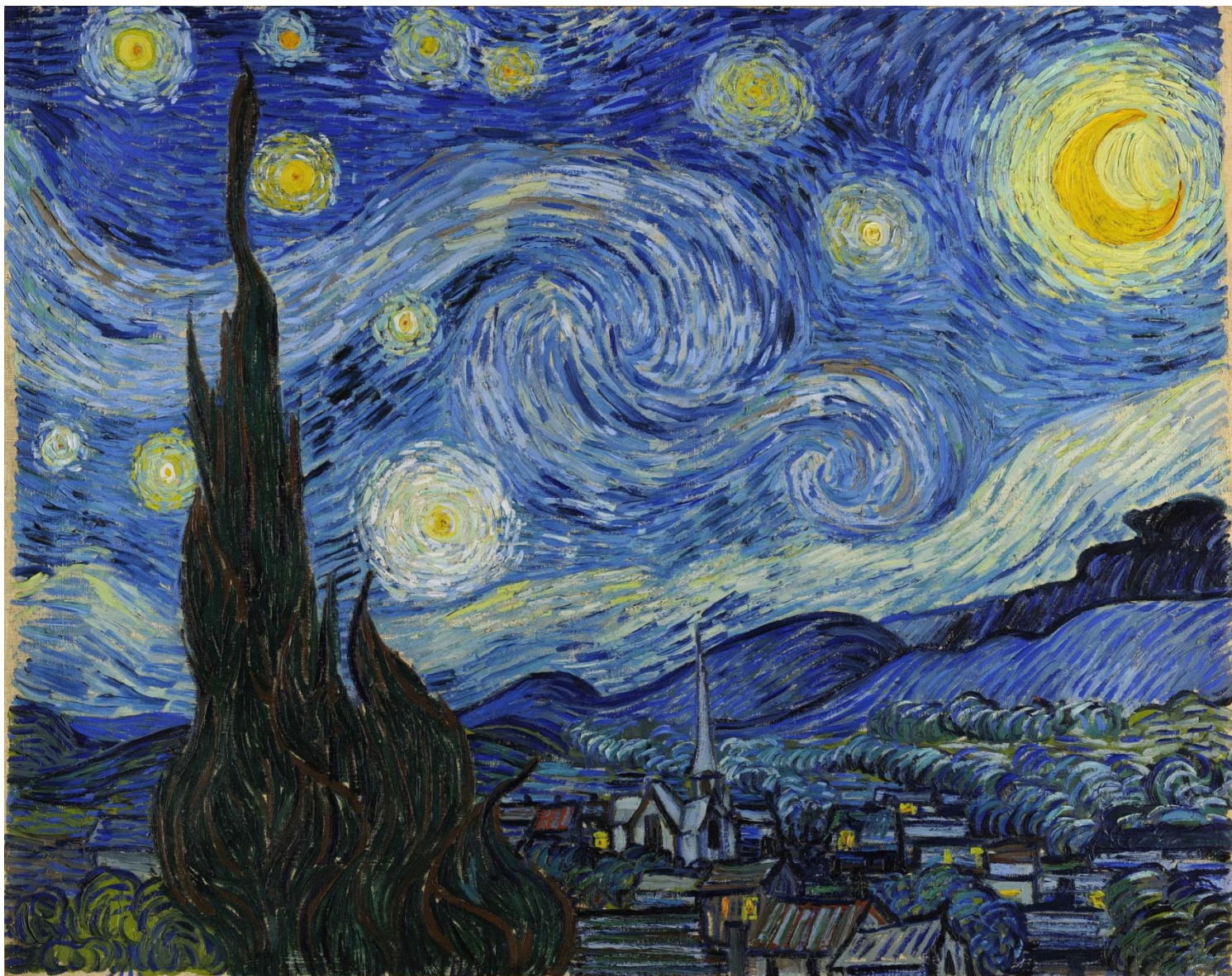
Винсент Ван Гог. Звездная ночь.