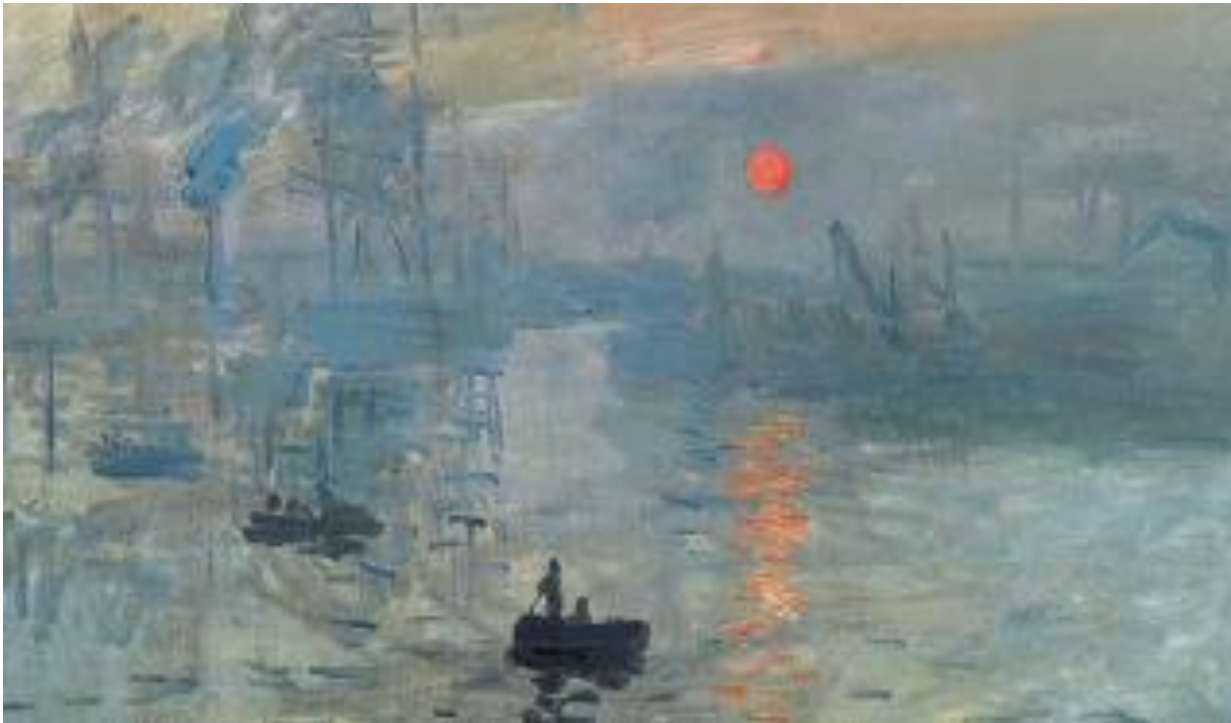
Впечатление. Восход солнца. Франция. XIXв.