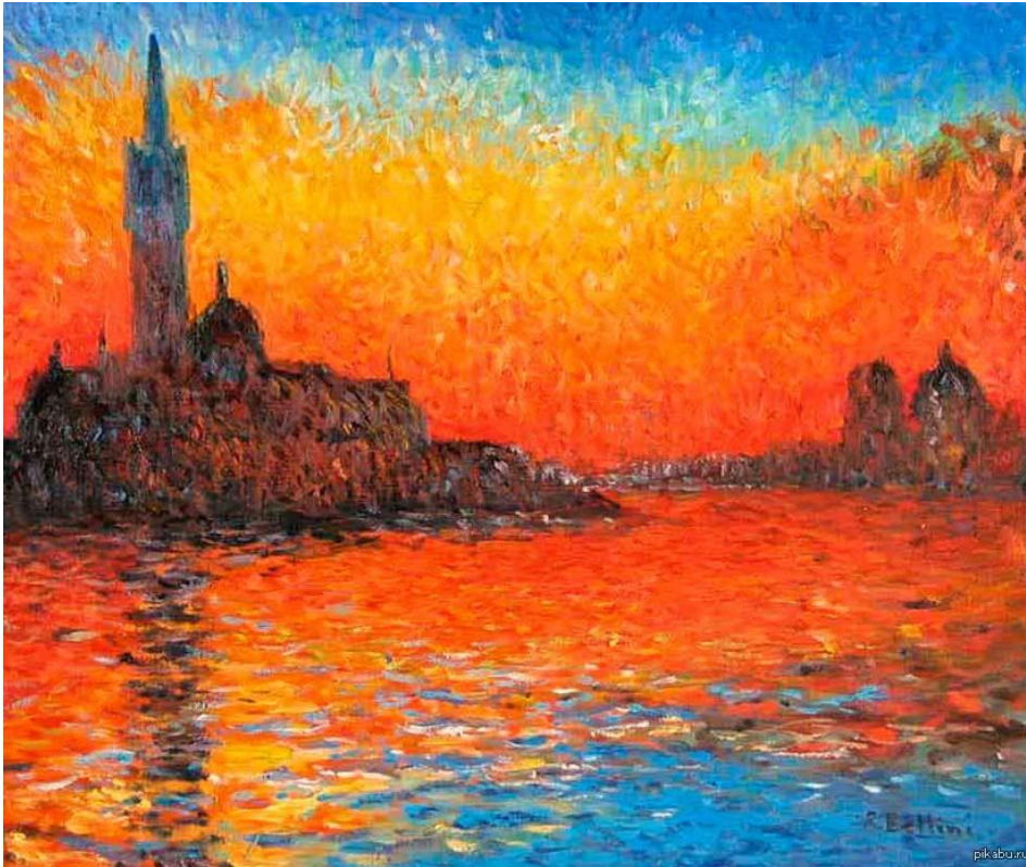
Клод Мане. Сумерки. Венеция.