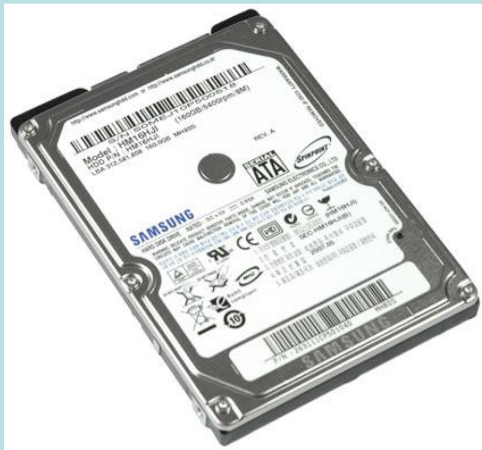
Жёсткий диск Samsung (НЖМД)