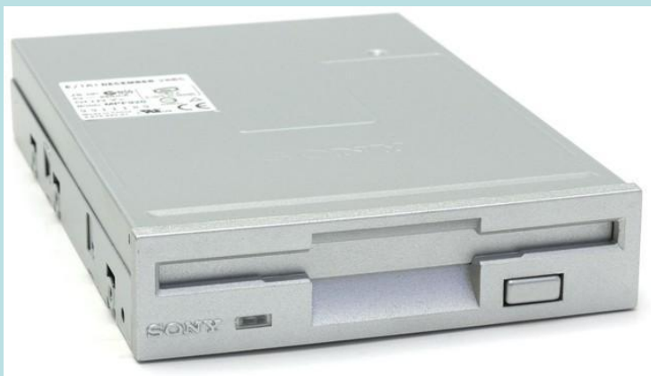
Дисковод 3.5" (НГМД)

В накопителях на гибких магнитных дисках (НГМД) и накопителях на жестких магнитных дисках (НЖМД), или «винчестерах», в основу записи информации положено намагничивание ферромагнетиков в магнитном поле, хранение информации основывается на сохранении намагниченности , а считывание информации базируется на явлении электромагнитной индукции .