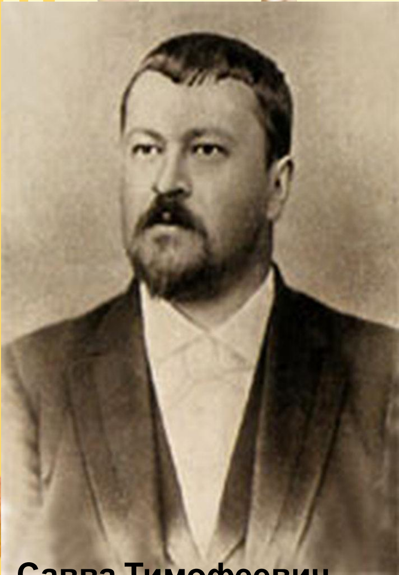
Савва Тимофеевич Морозов

Отменил наказания и штрафы, введенные отцом, обеспечил качественное медицинское обслуживание, первый из промышленников ввел пособия для беременных женщин , работавших на фабриках, жертвовал на строительство больниц, родильного приюта. Давал деньги на издание книг. Огромную поддержку в период формирования он оказал МХАТу. В общей сложности на нужды театра он издержал около полумиллиона рублей – огромные деньги. При этом условия доступности театра обычным зрителям и,