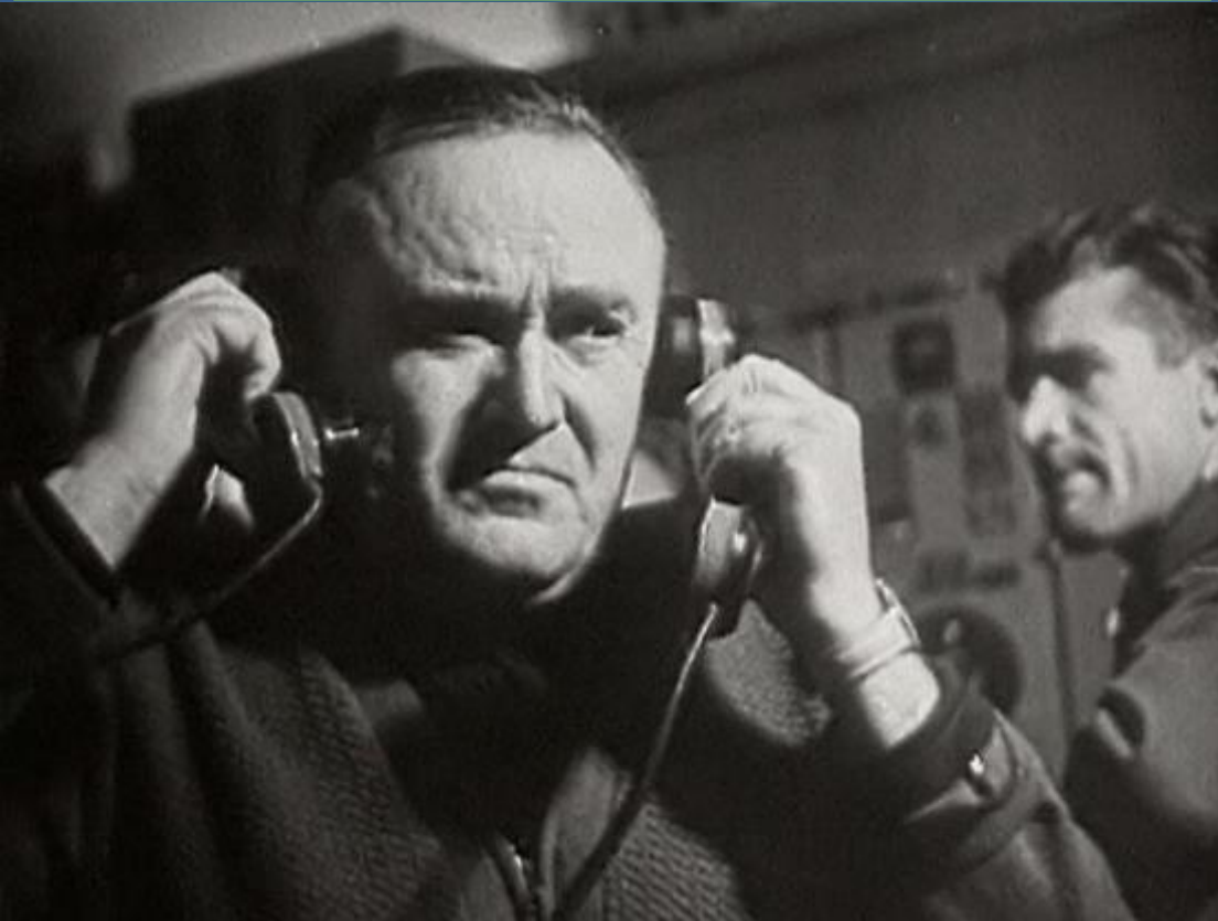
Академик Сергей Павлович Королев.

22. Назовите выдающегося конструктора ракетно-космических систем, с именем которого связаны первые победы нашей страны в освоении космоса.