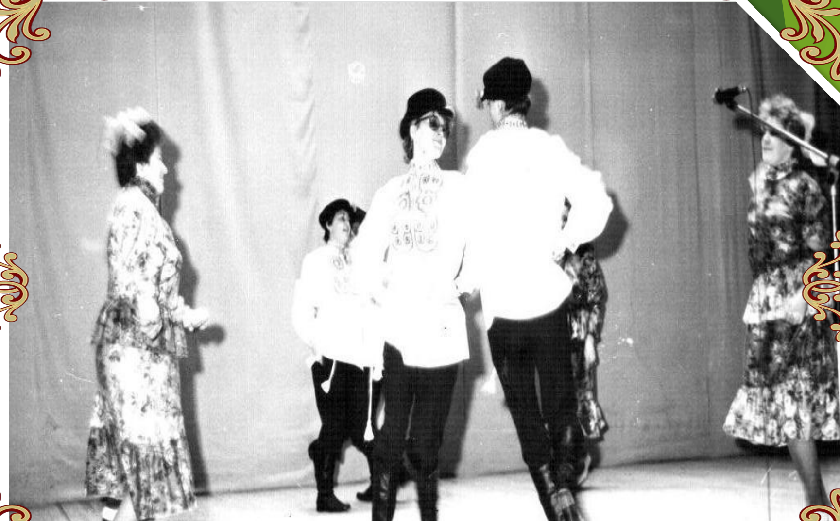
Народные гуляния. Камешки. 1982 год. На сцене сельского клуба.