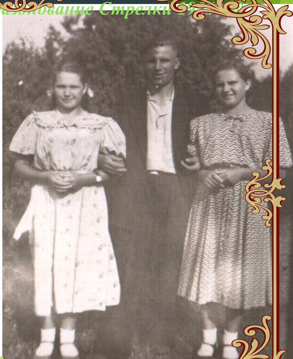
Празднование Стрелки 1952 год.