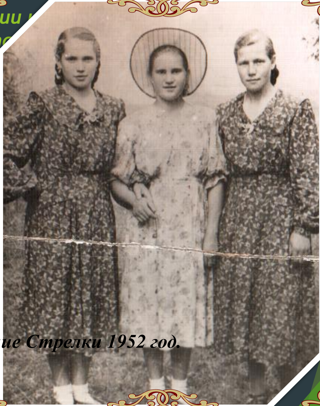
Празднование Стрелки 1952 год.