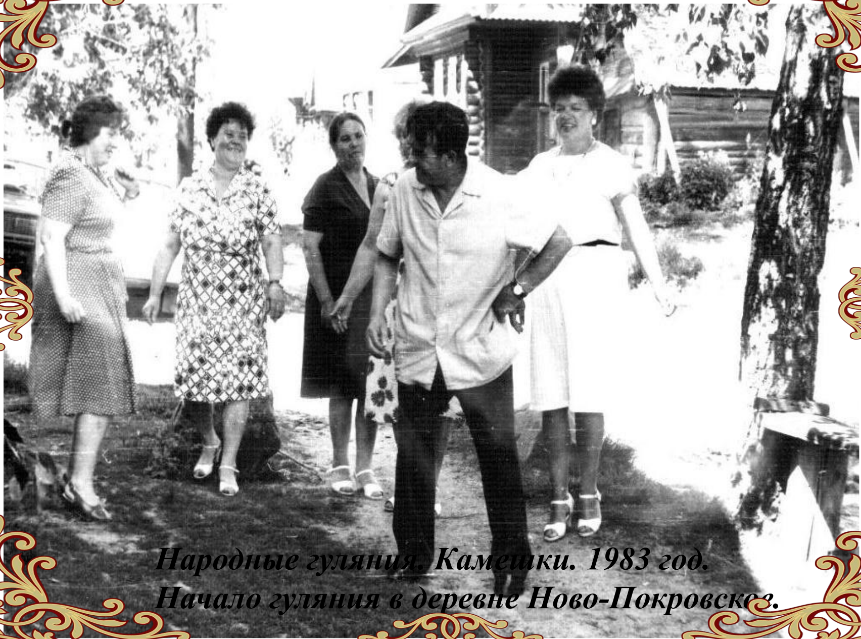
Народные гуляния. Камешки. 1983 год. Начало гуляния в деревне Ново-Покровское.