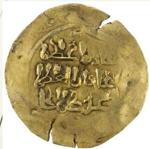
Золотой динар Чингисхана.