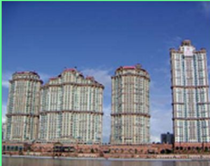
Жилой комплекс «Алые паруса». Москва

Однако культура современного мира в основном интернациональна, в ней все меньше и меньше остается места традиционным вкусам и представлениям. Сегодня на разных концах планеты люди пользуются одинаковыми предметами быта, носят похожую одежду, ездят на машинах одних и тех же марок, живут в типовых домах и квартирах, слушают одни и те же музыкальные произведения, смотрят одни и те же фильмы. Но несмотря на это каждый народ имеет свое неповторимое искусство.