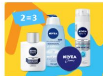
Уходовая косметика Nivea