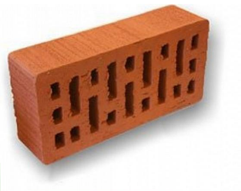
Экскурсия на завод строительных материалов ЭТАЛОН