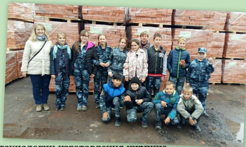
Мы увидели всю последовательную цепочку технологии изготовления кирпича