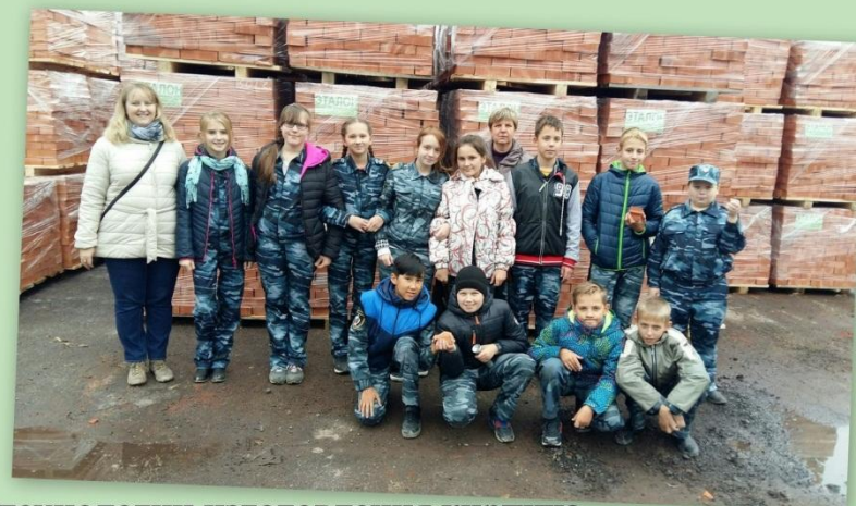
Мы увидели всю последовательную цепочку технологии изготовления кирпича