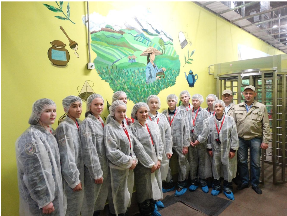
ООО «Орими Трейд»