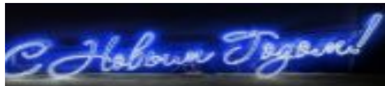
светодиодное пано «С новым годом!»