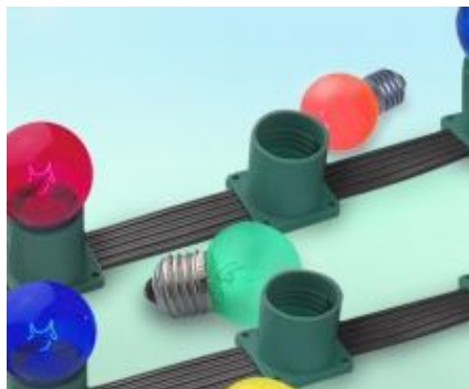
светодиодная гирлянда (300 м)