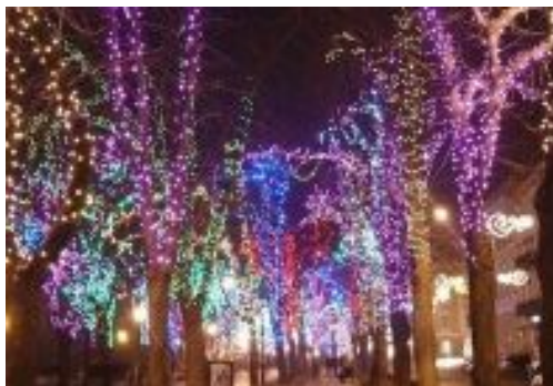
гирлянда для украшения деревьев (100 м)