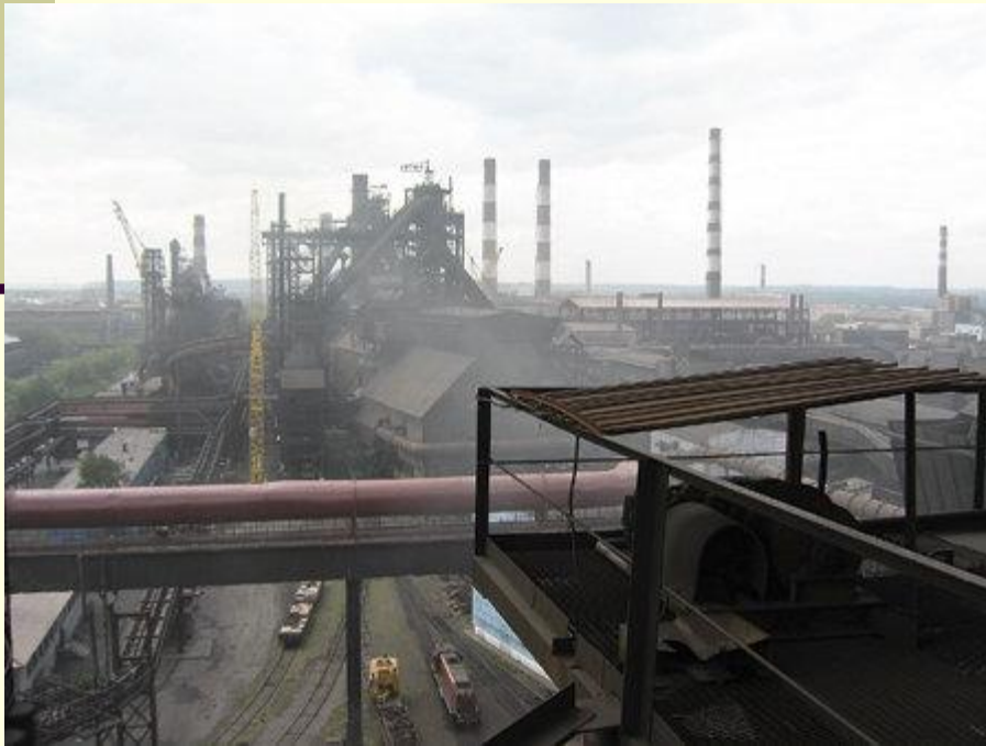
Западно-Сибирской металлургический завод