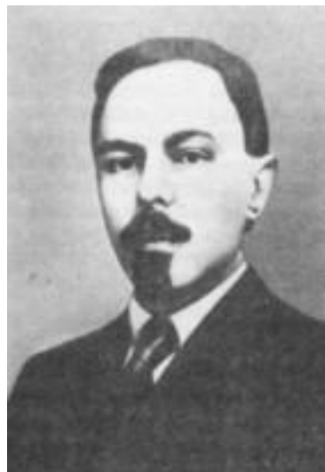
Г. Я. Сокольников