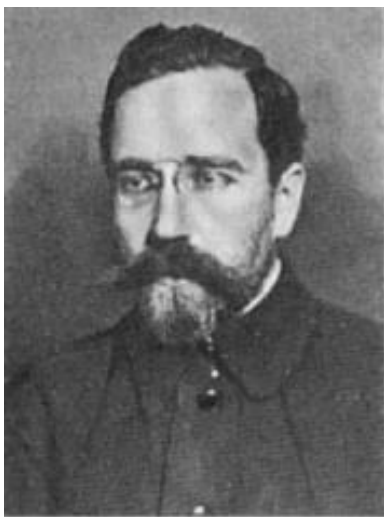
Л. Б. Каменев