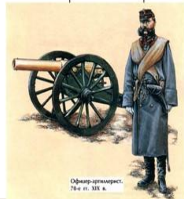
Офицер-артиллерист. 70-е гг. XIX в.