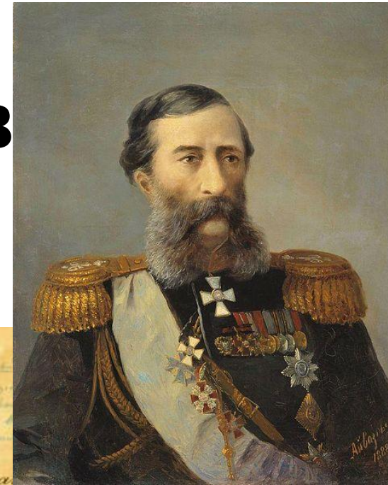
М.Т. Лорис-Меликов Министр внутренних дел Российской империи