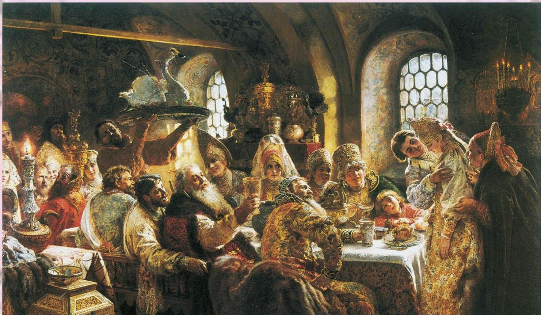
Свадебный пир в боярской семье