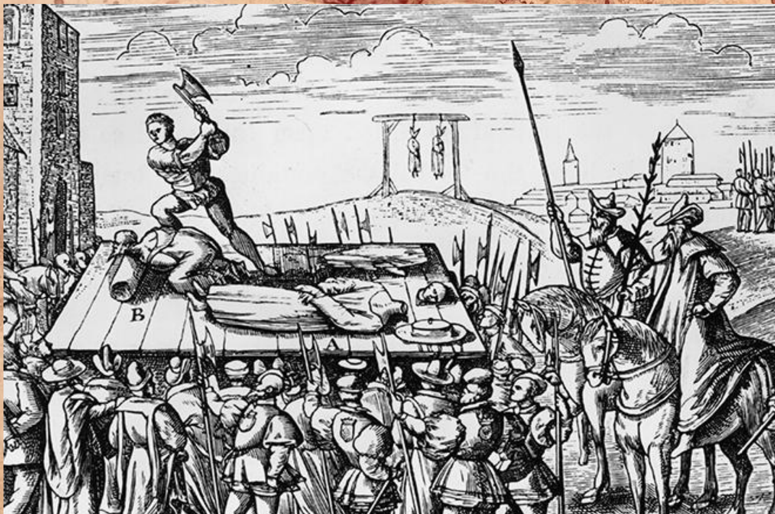
Казнь Томаса Мора