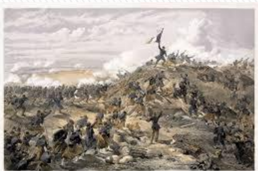
THE BATTLE OF SEVASTOPOL