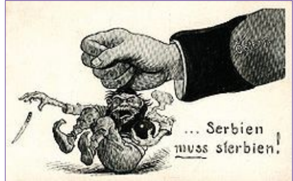
Австрийская карикатура «Сербия должна погибнуть»