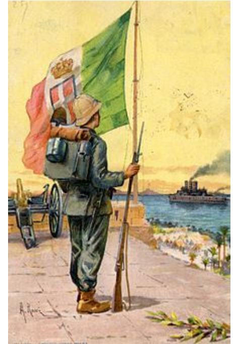
Итальянская открытка, посвященная войне. 1911 г.

Государства Балканского союза напали на Османскую империю