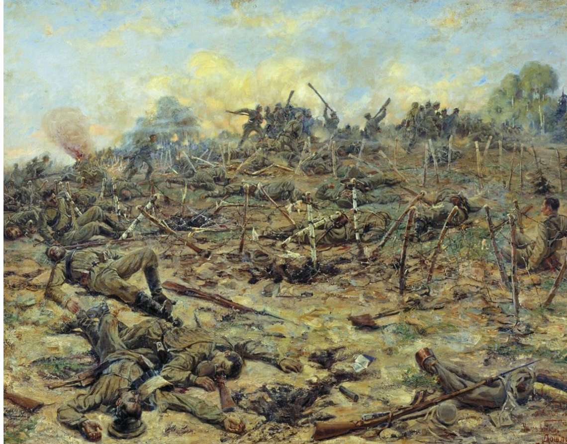
Картина Петра Карягина, «Ужас войны. Дошли!» (1918)