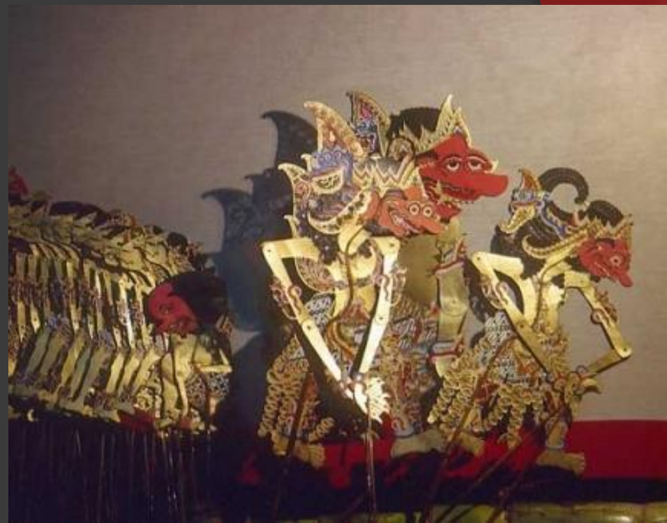
Индонезийский теневой театр ваянгулит.