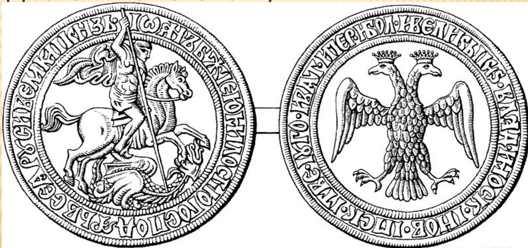
Печать Ивана III Васильевича. Конец XV в. Прорись А.Г. Силаева.