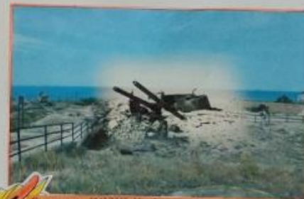
Севастополь. 1942/2018. 35-я береговая батарея. Sevastopol. 1942/2018. The 35th Naval Battery.