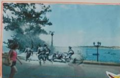
Севастополь 1944/2018 Штурмовая группа на Приморском бульваре. Sevastopol 1944/2018 Soviet Marines are on the Primorsky boulevard.