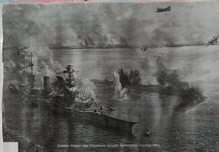
Линкор «Марат» при отражении штурма Ленинграда. Сентябрь 1941г.

Это действительно так. Уже через несколько секунд в Кронштадте зашел сигнал воздушной тревоги. Атака фанатов была отбита, хотя наши войска все же понесли потери. 22 и 23 сентября авиатаки повторялись. Но уж если в первый раз этот номер у фюрера не прошел, то вторая и третья атаки не удалась и позднее!