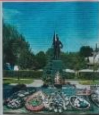
Мемориал в Гомеле