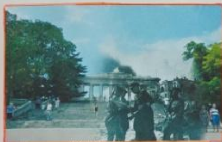
Севастополь 1944/2018 Графская пристань. Sevastopol 1944/2018 Suvorov's Quay.