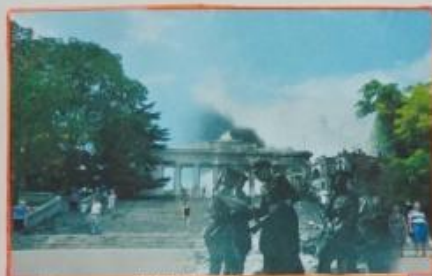
Севастополь 1944/2018 Графская пристань. Sevastopol 1944/2018 Count's Quay.