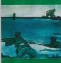
А. Сидоренко. А. Лихачев. Братская могила (1981)

★ ЗДЕСЬ С 1938 г. ПО 1941 г. ЖИЛ ГЕРОЙ СОВЕТСКОГО СОЮЗА БОРИС АНДРЕЕВИЧ ЦАРИКОВ