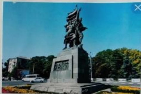
Памятник воинам-защитникам г. Новороссийска

Был открыт 9 мая 1961г. в центре города, на площади Свободы. Возружен в честь воинов Красной Армии, моряков Черноморского флота и партизан, героически защищавших город и разгромивших врага у стен Новороссийска в годы ВОВ.