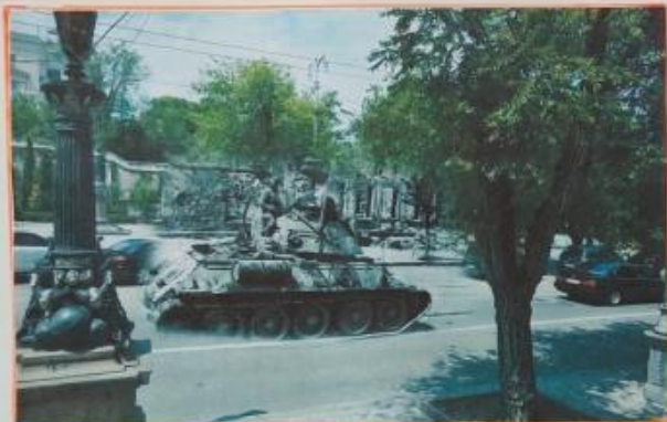
Севастополь 1944/2018 Улица Ленина. Танк Т-34 "Мститель" с морскими пехотинцами на борту врывается в город. Sevastopol 1944/2018 T-34 tank breaks into the city with the Marines on board.