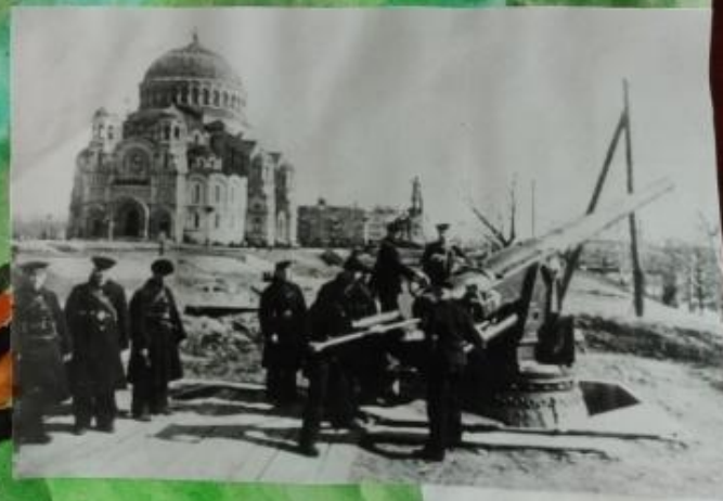
Кронштадт в годы блокады

Из-за отсутствия самоотраженности в отставке кронштадтцев, Балтийское море не было неосвоенным ни одной минутой, враг не пробился к Ленинграду и Москве, и русский народ выстоял в этой чудовищной войне.