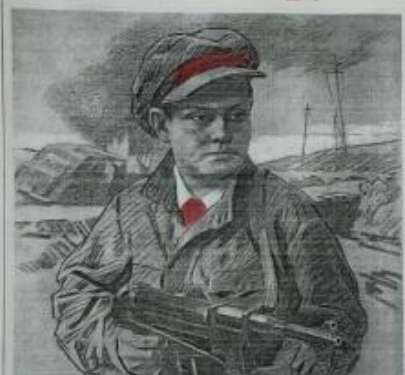
ПРИСВОЕНО звание Героя Советского Союза