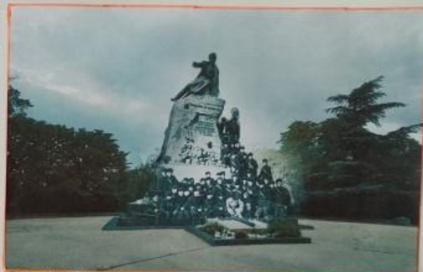
Севастополь 1942/2018 Морская - защитники города у памятника адмиралу Корнилову. Памятник был разрушен и переплавлен гитлеровцами. После войны его восстановили по эскизам. Sevastopol 1942/2018 The Marines-defenders of Sevastopol stay at Admiral Kornilov's monument. The monument was destroyed and melted down by the Nazis. After the war it was restored under the sketches.