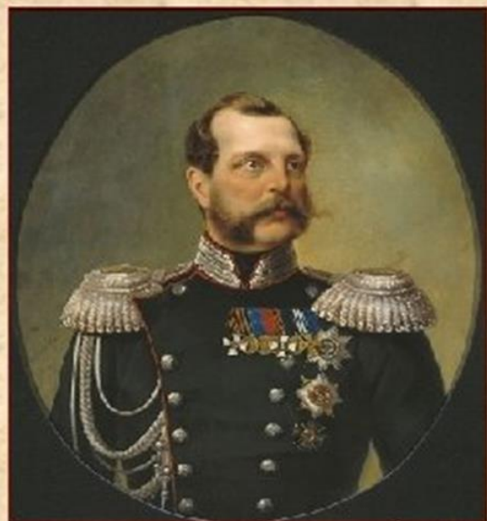
Император Александр II (освободитель)

Крепостное право в России было отменено. Несмотря на то, что положение большинства крестьян оставалось тяжёлым, многие из них смогли уйти из деревень в города, на промышленные предприятия в поисках заработка. Так стал образовываться рабочий класс.