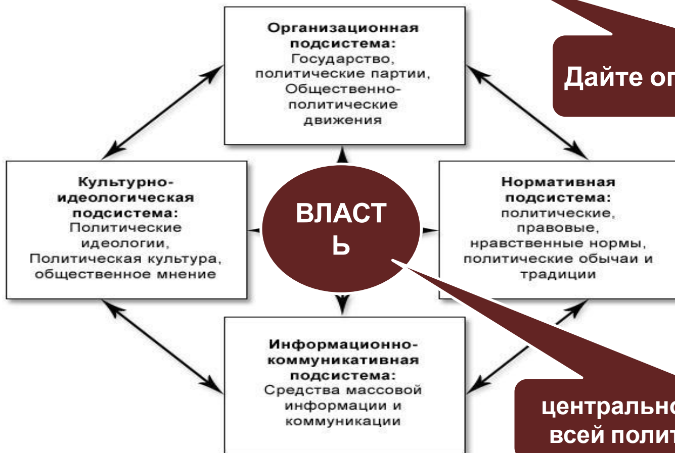
Схема: Структурные компоненты политической системы

ПОЛИТИЧЕСКАЯ СИСТЕМА – это совокупность государственных, партийных и общественных органов и организаций, участвующих в политической жизни страны.