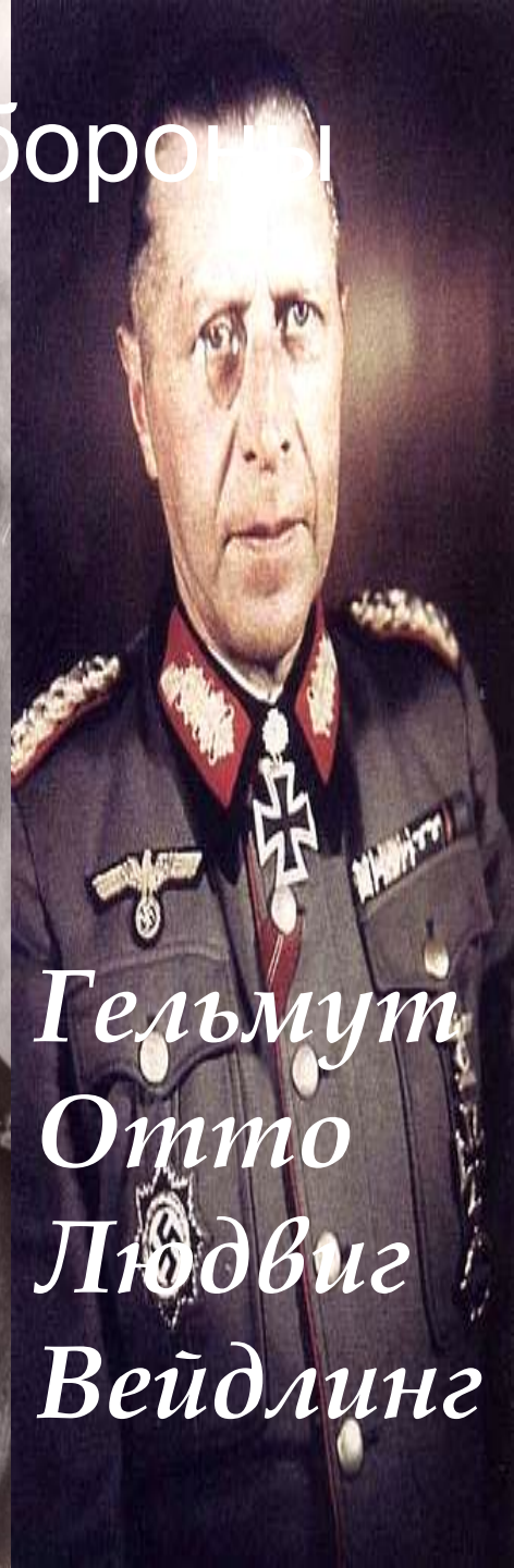
Гельмут Отто Людвиг Вейдлинг