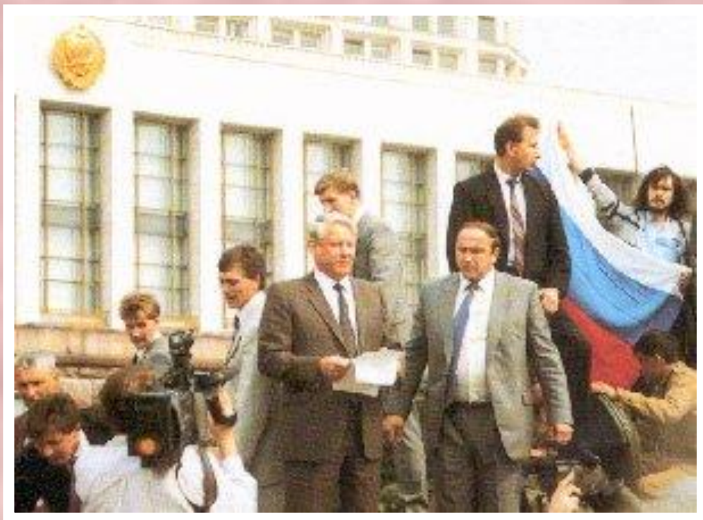
Б.Ельцин у Белого Дома. Август 1991 г

По призыву Ельцина тысячи москвичей собрались у здания Белого дома, чтобы предотвратить его штурм. 21 августа ВС РСФСР поддержал руководство республики. в тот же день Горбачев возвратился в Москву, а члены КГЧП были арестованы. 25 августа М.Горбачев собрал ВС СССР и добился от его депутатов решения о самороспуске. В конце августа все союзные республики объявили о своей полной независимости