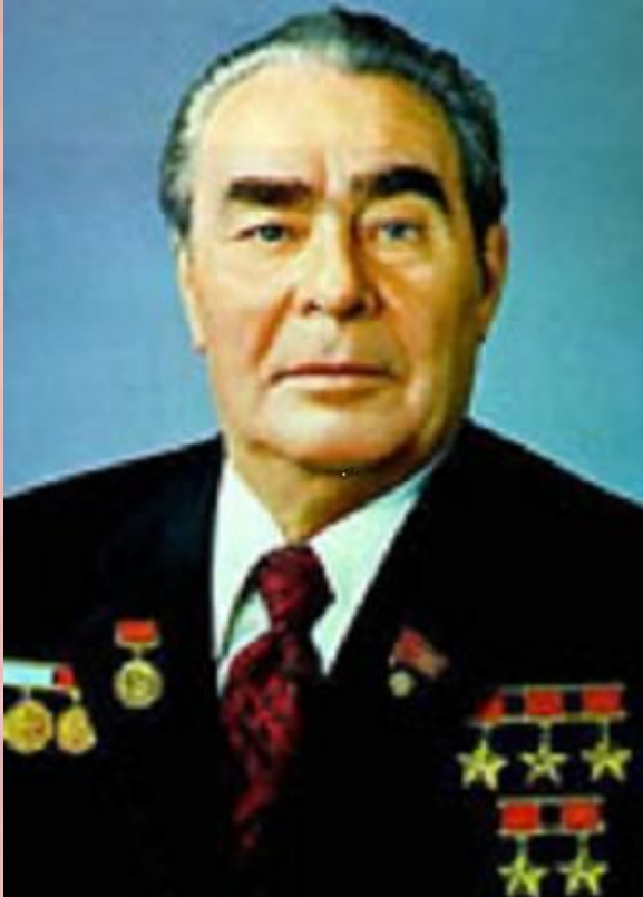
Л.И.Брежнев 1964-1982г ноябрь