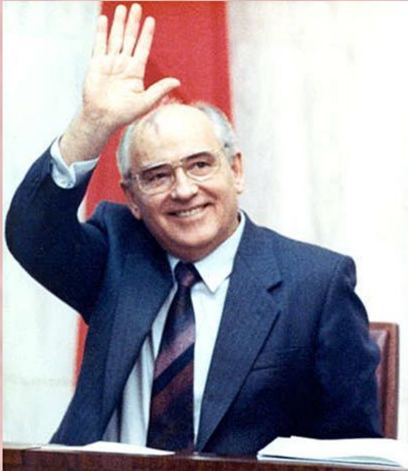
Горбачев М.С. 1985-1991 гг. Генеральный секретарь ЦК КПСС)