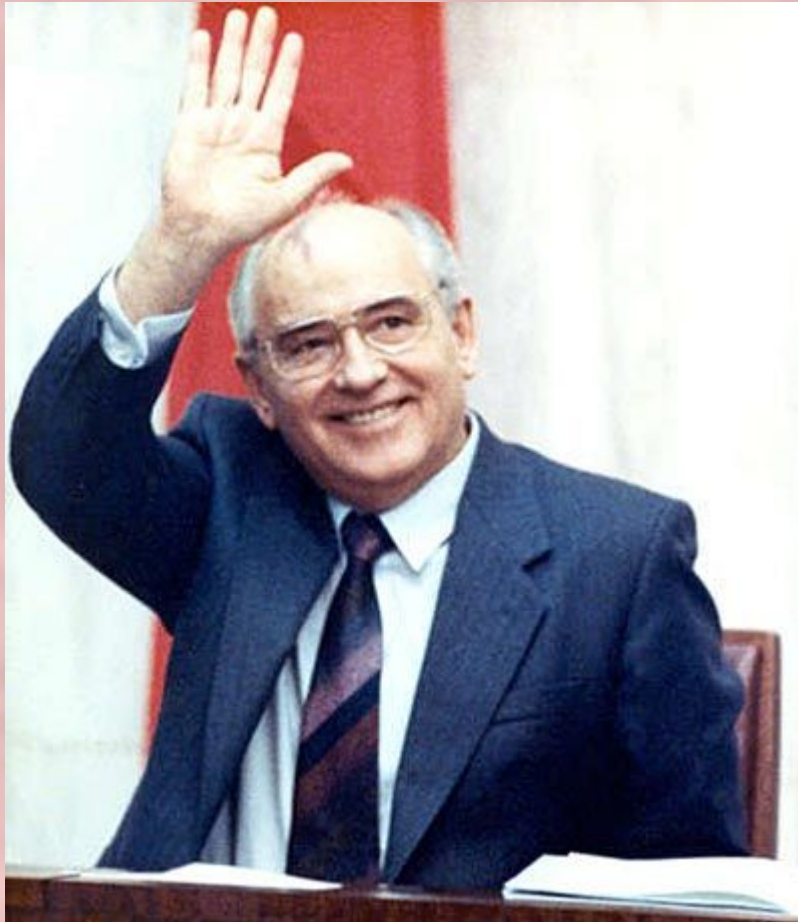
Горбачев М.С. 1985-1991 гг. Генеральный секретарь ЦК КПСС)