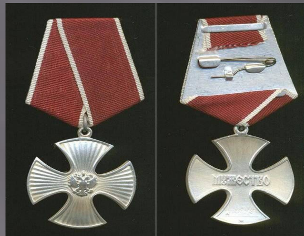
Орден мужества, врученный Вячеславу посмертно