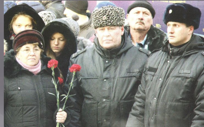
Прощание с офицером