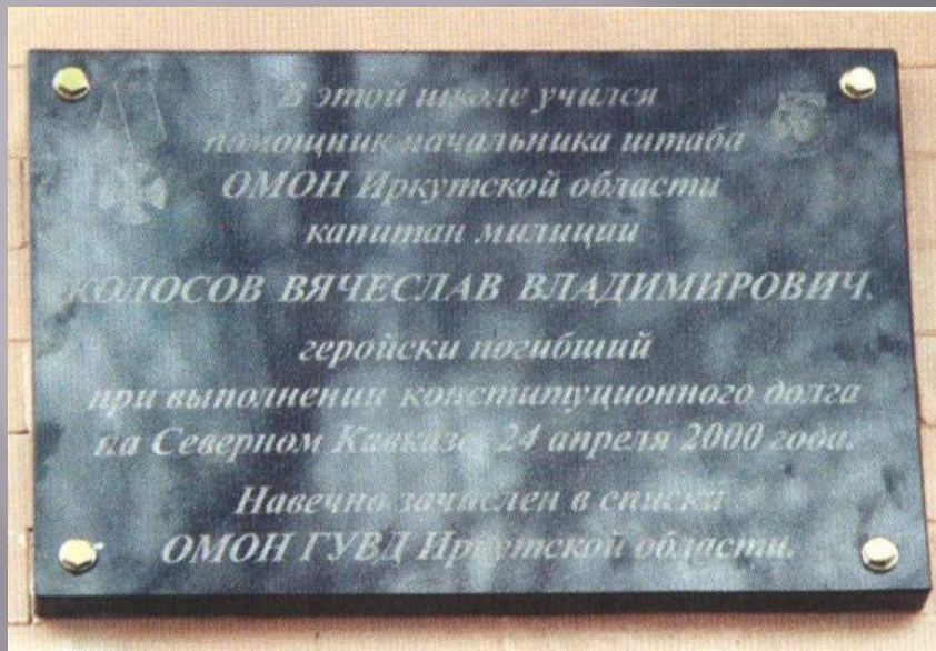
Мемориальная доска на фасаде школы №7