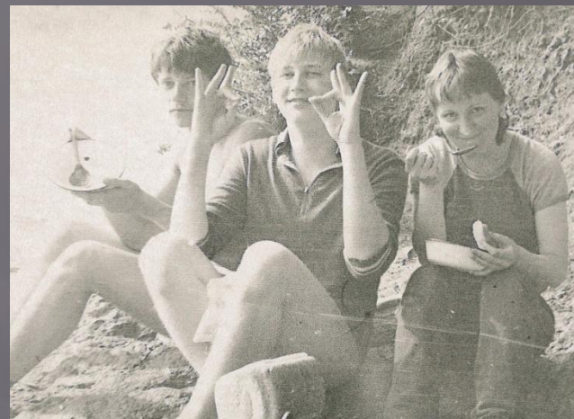
Лето 1982 г