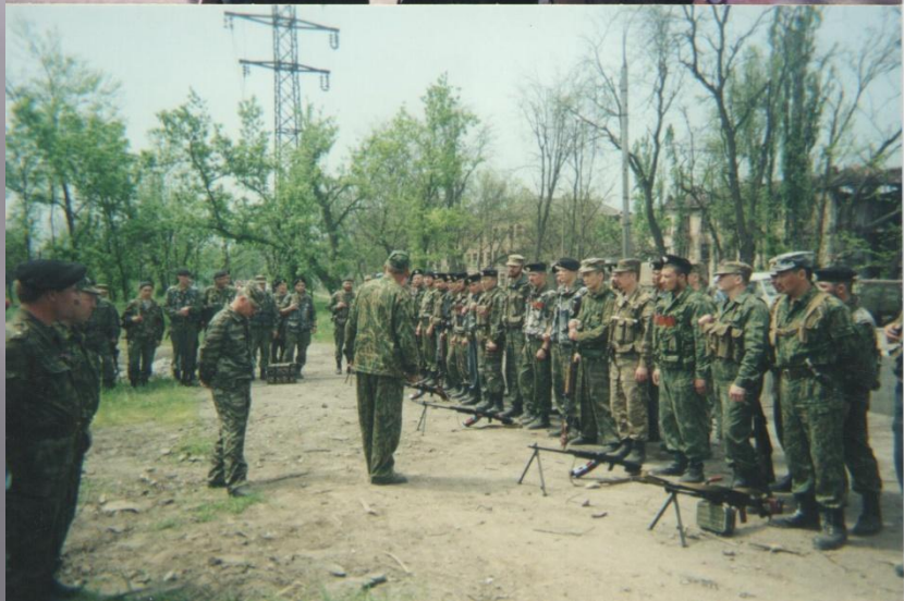
Сборы в Чечне