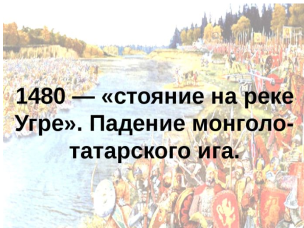
1480 — «стояние на реке Угре». Падение монголо-татарского ига.