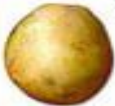
Картофель (Цветки, клубень и лист)