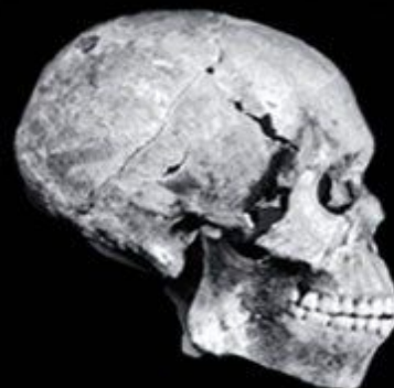
Homo sapiens sapiens