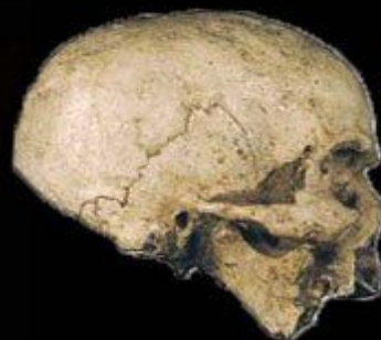
Homo sapiens sapiens