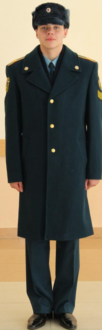
Зимняя парадная форма одежды