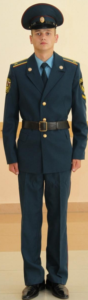
Летняя парадная форма одежды