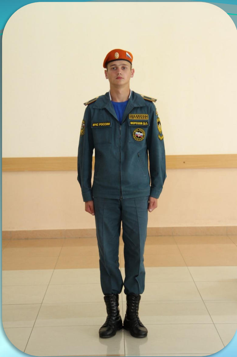
Летняя повседневная форма одежды