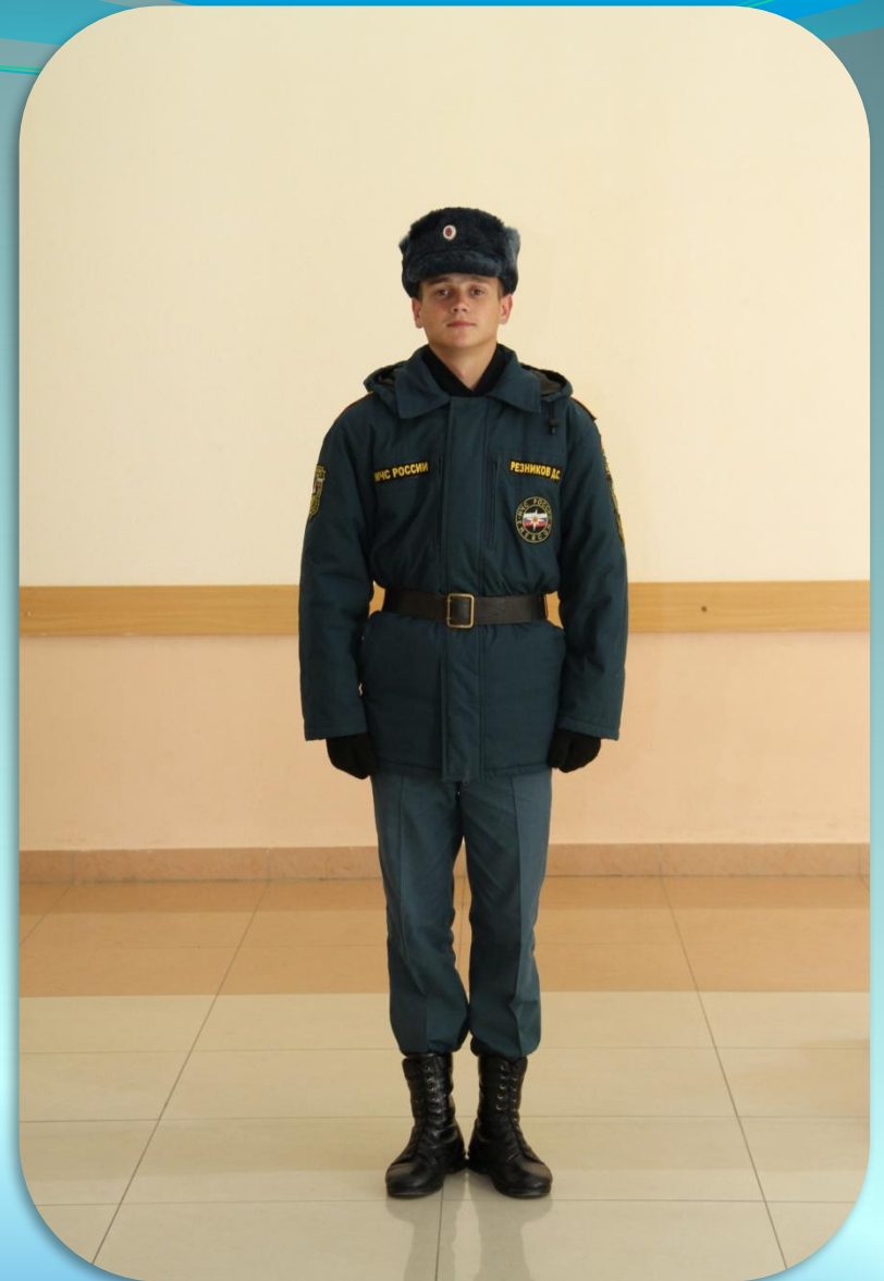
Зимняя повседневная форма одежды