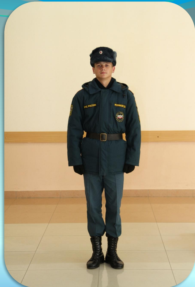
Зимняя повседневная форма одежды