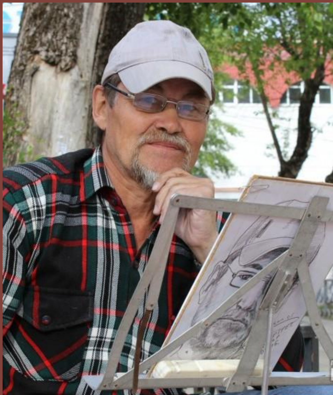
Степан Григорьевич Семяшкин